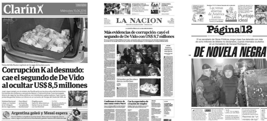
Figura 1: Tapas de Clarín, La Nación y Página/12 del 15 de junio de 2016.

Dice Patrick Champagne: “Las imágenes ejercen un efecto de evidencia muy poderoso: parecen designar, sin duda más que el discurso, una realidad indiscutible aunque sean igualmente el producto de un trabajo más o menos explícito de selección y construcción” (2000: 2). Desde un primer momento, la detención de López generó un efecto de certeza: aquello exhibido estaba signado por la corrupción. De tal modo lo mostraron las tapas del 15 de abril de 2016 de los principales diarios analizados.