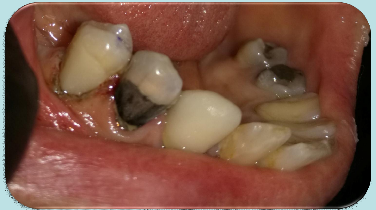
Caso clínico terminado.