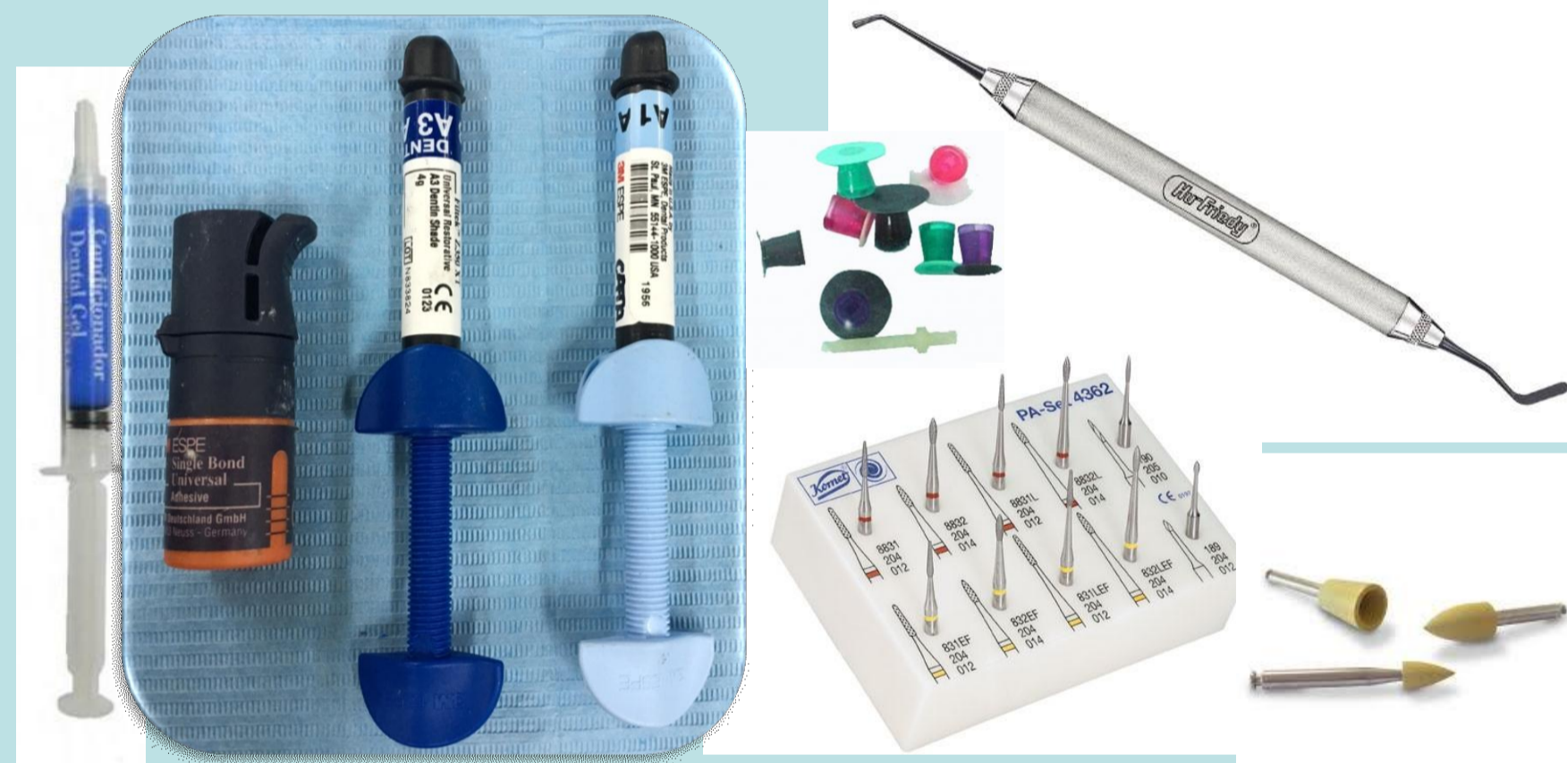
Elementos utilizados para la técnica adhesiva, restauración y terminación.