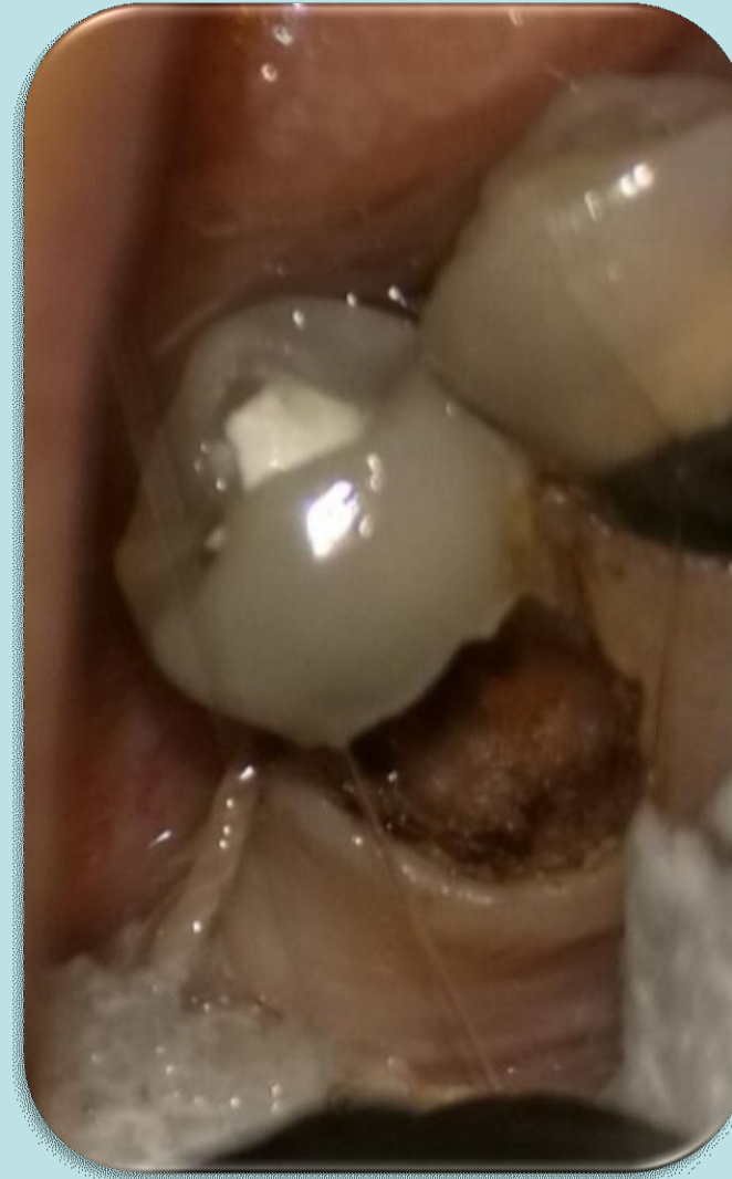
Eliminación de tejido cariado