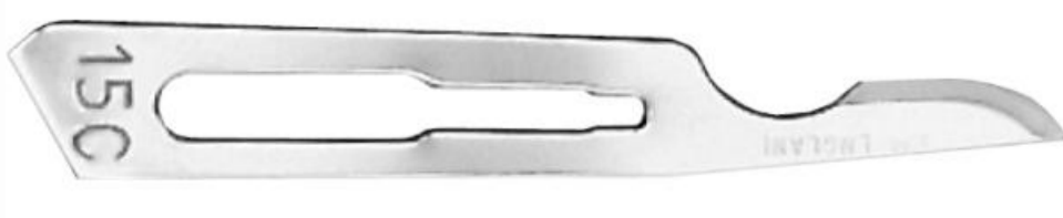
Elementos utilizados para realizar gingivectomía