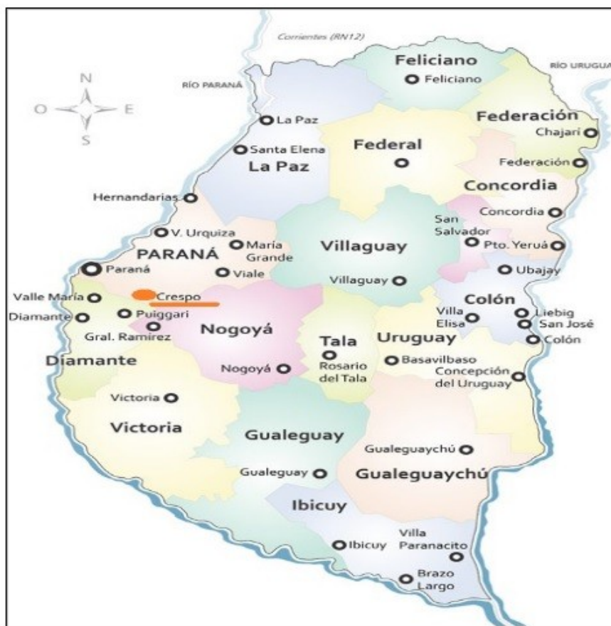
Figura 1. Localización geográfica de Crespo, Entre Ríos