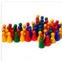
Animarse a participar