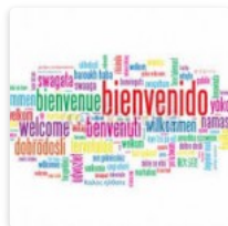
Presentaciones de los nuevos integrantes