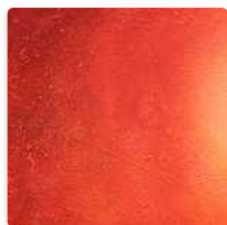
La red social educativa Edmodo – Parte 1