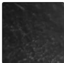
Emociones y TIC: lo que dice la teoría