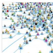
Teoría de Siemens – Parte 2