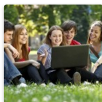
Ser Estudiante Hoy – Parte 2