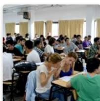
Ser estudiante hoy -Parte I