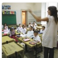
Ser alumno hoy, docente mañana – Parte 2