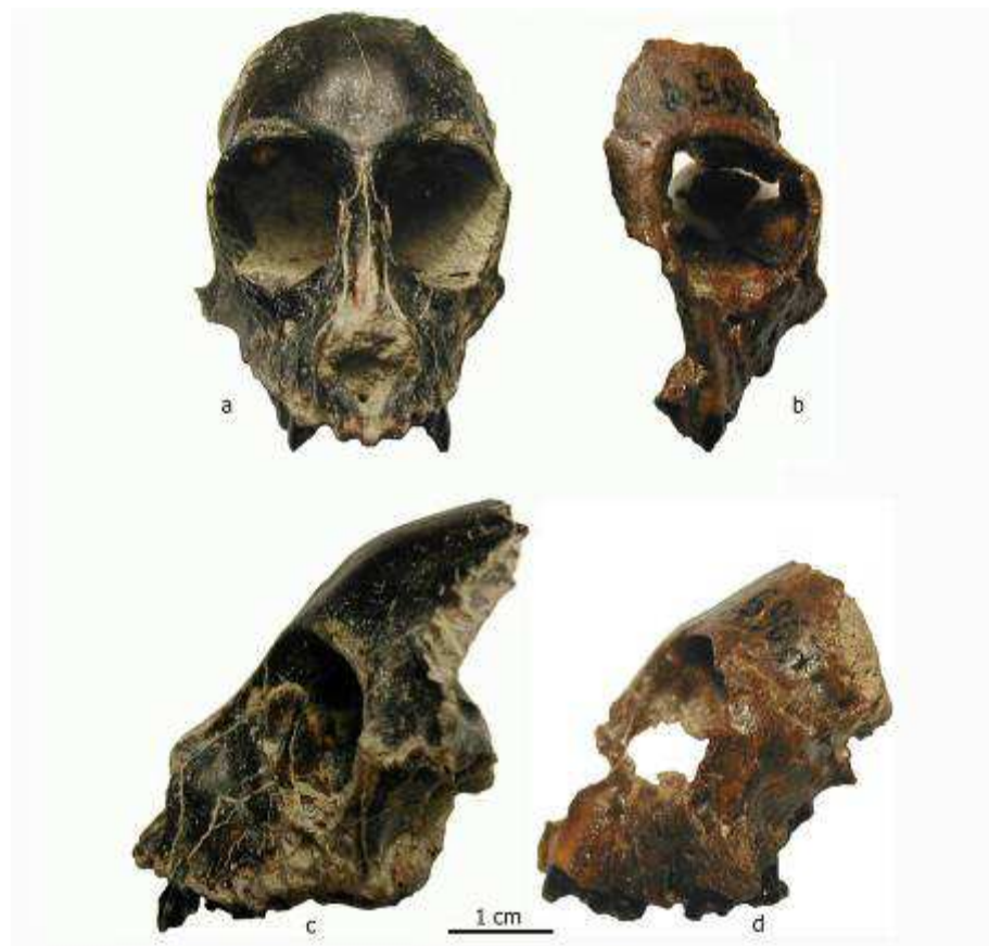
Figura 2. Comparación entre MPM-PV 5000, holotipo de Killikaike blakei (a, c), y MACN-A 5968, cráneo parcial de Homunculus patagonicus (b, d), en vista frontal y lateral. Son dos formas representativas del registro fósil patagónico, demostrando las diferencias morfológicas fundamentales entre cebinos y homunculinos primitivos mencionadas en el texto.

como ocurre en todos los platirrinios fósiles de Patagonia de los que se conservan restos craneales. Esta morfología ha sido interpretada como una característica que define al grupo patagónico como stem de los restantes Platyrrhini (Kay et al. , 2008; Kay y Fleagle, 2010); sin embargo, no se ha considerado la posibilidad de que sean, en realidad, características primitivas retenidas de potenciales ancestros del Viejo Mundo, ya que aquéllos conservan el mismo prognatismo típico de los primates primitivos, previos a la divergencia entre platirrinios y catarrinos. En este sentido, es esperable que el rostro prognato de Killikaike difiera del actual Saimiri y también de Cebus , y por otra parte ambos son portadores del rostro más reducido entre los primates del Nuevo Mundo. Esta característica acompaña la estrechez interorbitaria extrema (de modo que en Saimiri se forma también una fenestra en la pared interorbitaria) y el enorme desarrollo del cerebro anterior. Los molares superiores de Killikaike conservan similitudes con Dolichocebus , con crestas algo más marcadas que en Homunculus e hipocono bien desarrollado, pero que no igualan a Saimiri en su morfología general. Vale decir que las mayores similitudes con Saimiri se hallaron a partir de comparaciones de las órbitas y el hueso frontal sumado al endocráneo.