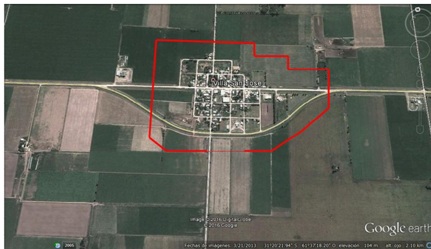
Figura 2. Imagen satelital de Villa San José con el límite de 100m (aproximado) del área urbana.

Si bien los productores de la Cooperativa estaban al tanto de las denuncias y del proceso de discusión de la nueva normativa, no participaron en el armado de la misma.