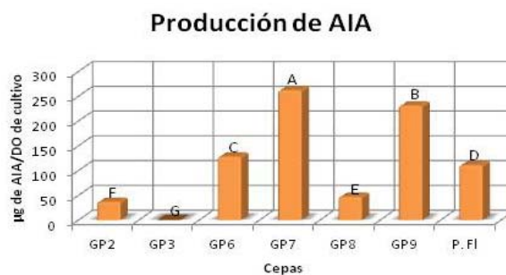
Figura 1: evaluación cuantitativa de la producción bacteriana de AIA.

El diámetro de las colonias de los hongos a las 48 hs de la incubación mostró que las cepas PF, GP2 y GP9 fueron las de mayor actividad antifúngica sobre F. graminearum . Mientras que todos los aislamientos bacterianos inhibieron el desarrollo de F. solani , excepto GP3 que no mostró actividad antifúngica. En parte esto fue debido a que el medio Agar CAS limitó el crecimiento de la cepa. La evaluación realizada a los 7 días de incubación mostró que todos los aislamientos excepto GP3, GP6 y GP7 inhibieron el crecimiento de F. graminearum (Fig. 3). En contraposición solo los GP9 y GP2 inhibieron significativamente el crecimiento de F. solani . El análisis del efecto de los aislamientos a las 48 hs y a los 7 días de incubación demuestra que o bien los aislamientos bacterianos pierden la capacidad de inhibir el crecimiento fúngico o el hongo se adapta los inhibidores producidos por las bacterias.