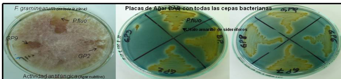
Figura 2: Evaluación cualitativa de la actividad antifúngica en Agar nutritivo y producción de sideróforos en Agar CAS.