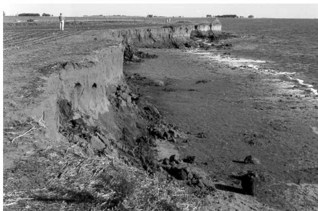
Figura 2. Barranca noreste de la laguna El Doce.

La laguna El Doce se origina entonces a partir de una antigua hoya de deflación excavada durante el último período climático árido, donde además se formaron dunas eólicas en sus márgenes (Iriando 1987). Estas dunas hoy conforman topográficamente el sector más alto de este ambiente lagunar y es donde se ubica el mencionado sitio (Figura 2).