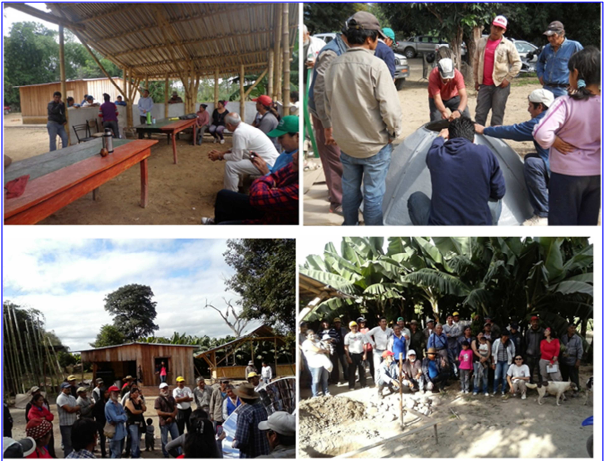
Figura 4: Imágenes de distintos momentos de los talleres realizados con integrantes de la Comunidades de Orán.