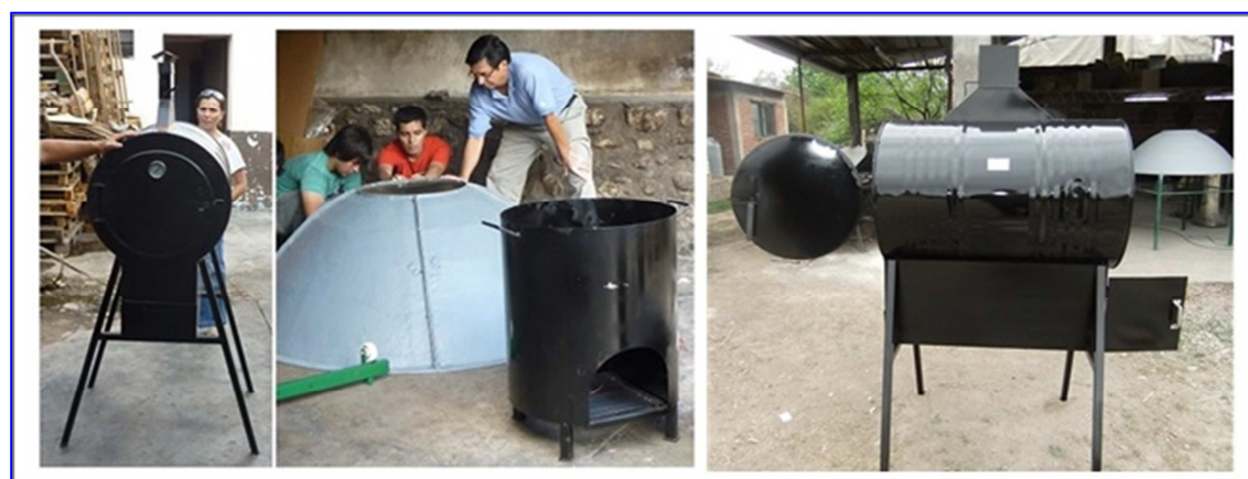
Figura 3: Horno a leña y cocina a leña de rendimiento mejorado.

En cuanto a los Talleres destinados a integrantes del Movimiento Nacional Campesino Indígena (MNCI), uno de ellos se llevó a cabo en el Taller de Física de la UNSa, en el que seis campesinos provenientes de la provincia de Córdoba aprendieron a construir Cocinas a Leña de rendimiento mejorado y calefón solar de manguera, con el objetivo que luego ellos puedan enseñar su construcción en sus comunidades de origen. Para posibilitar el viaje y la permanencia de una semana, los pasajes fueron pagados por el MNCI mientras que el albergue y comida fueron provistos por la Universidad. También se dieron charlas sobre el uso de las energías Renovables durante el año 2014 en la Escuela de Agroecología del MOCASE (Movimiento Campesino de Santiago del Estero) en Quimilí de esa provincia. Todas estas actividades dieron origen a la firma de un Convenio entre la UNSa y la Facultad de Ciencias Sociales de la UNC ( http://bo.unsa.edu.ar/dr/R2016/R-DR-2016-0046.pdf ).