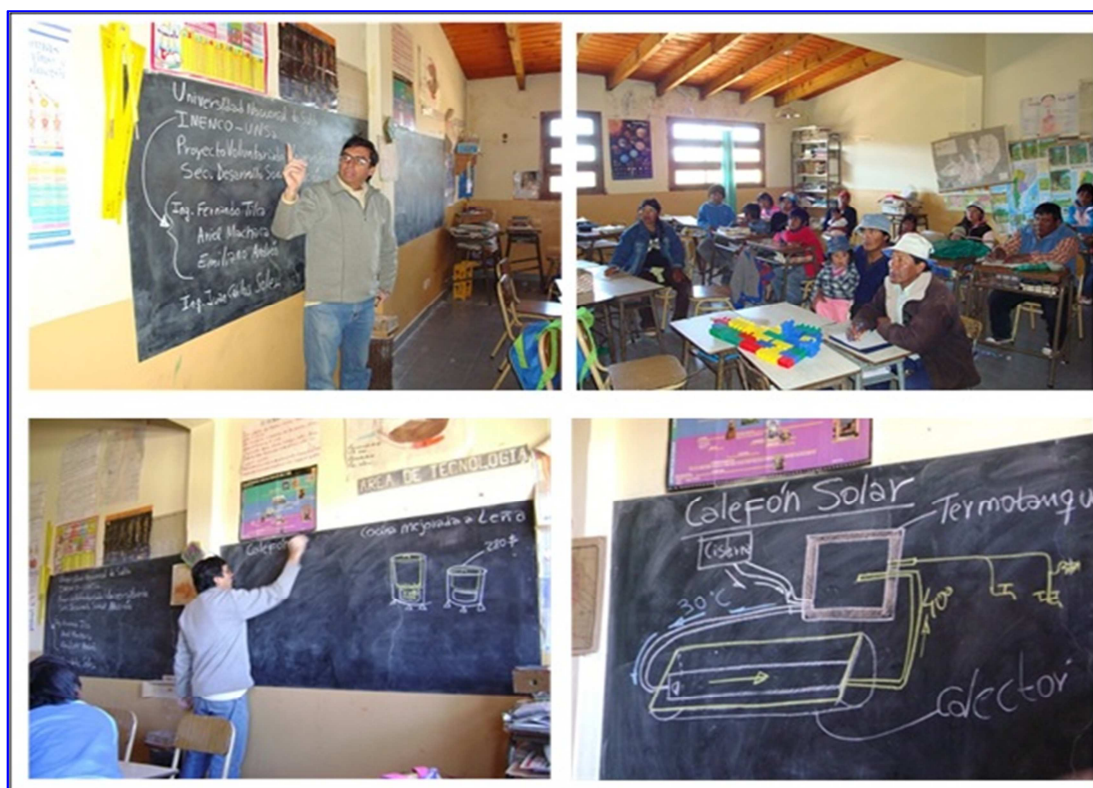
Figura 1: taller realizado en una de las comunidades andinas.

Esta cuestión, la de adopción y apropiación de la tecnología, se puede superar mediante la aplicación de una forma de trabajar que consiste en tener un diálogo directo entre los actores que serán los destinatarios de las nuevas tecnologías y los técnicos de la Universidad y de Institutos de Investigación. Un objetivo siempre necesario es el de conseguir que los destinatarios conozcan la tecnología; cómo funciona, cómo puede repararse en caso necesario y a partir de allí que manifiesten qué quipos desean tener, a los cuales luego les darán un uso real. La Figura 1 muestra uno de los talleres realizados en la Escuela de Las Mesadas (3300msnm). En este lugar se instalaron cocinas solares comunitarias tipo concentrador, con ollas de 25 litros y horno solar.