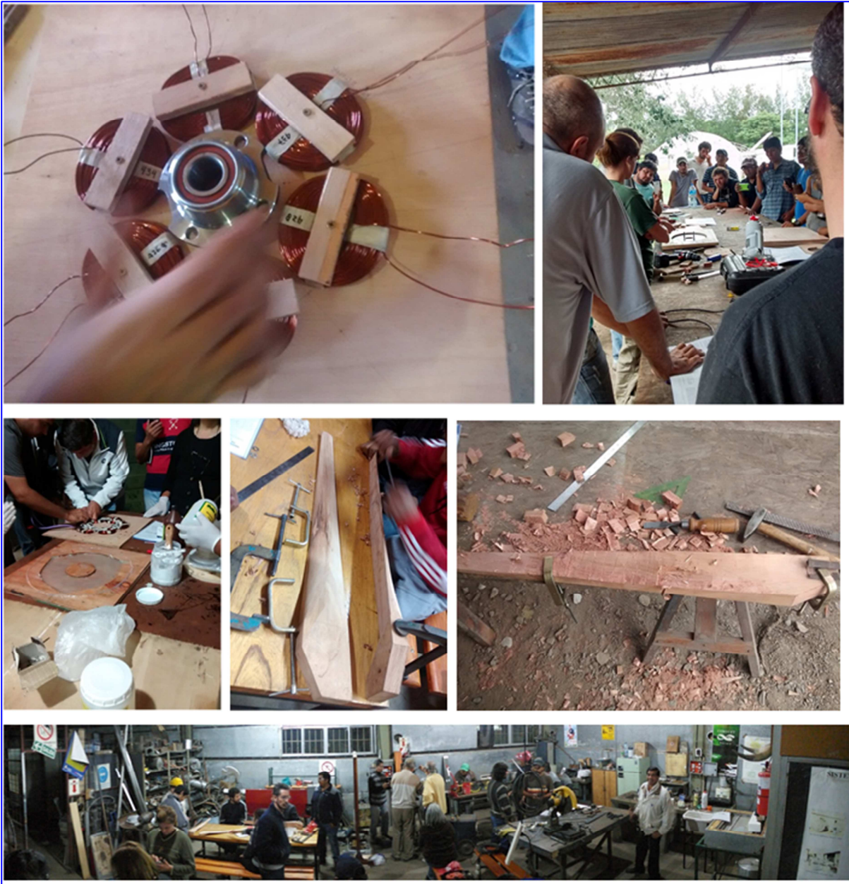
Figura 5: Construcción del aerogenerador de 1.80 m de diámetro en el curso de extensión.