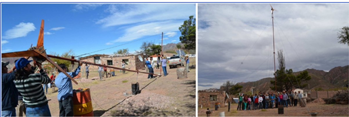
Figura 6: montaje del pequeño aerogenerador de 1.8 m de diámetro de palas. La torre es de 12 m.