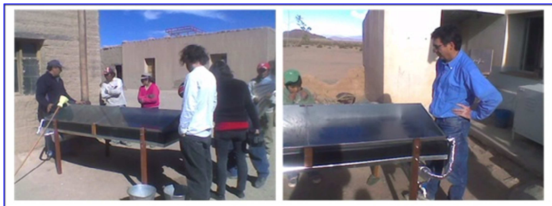
Figura 2: destilador solar de agua, en Esquina de Guardia, Salta.

En las comunidades del Departamento de Orán se instalaron tres cocinas solares comunitarias, tres cocinas a leña y tres hornos a leña de rendimiento mejorado y un sistema de bombeo fotovoltaico. Para ello se realizaron talleres el año anterior a la instalación de estos equipos, en los cuales estas comunidades los solicitaron (Figura 4).