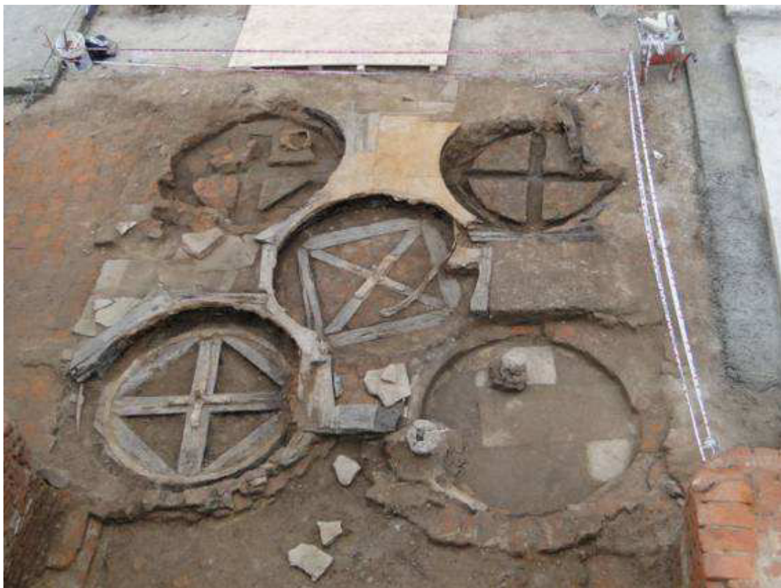
Figura 5. Fotografía de cinco de las nueve partes fijas de las estructuras circulares que componen el sistema de movilidad de mercaderías ubicado en la parte media del patio de maniobras.

Para evitar la condensación y con ello la procreación de colonias de microorganismos sobre la evidencia arqueológica, mediante un conducto de aire que recorre el patio de norte a sur de le inyecta aire, cada determinado cantidad de tiempo, el cual circula y sale por el lado opuesto mediante la presencia de rejillas de ventilación (véase Figuras 5, 6 y 7).