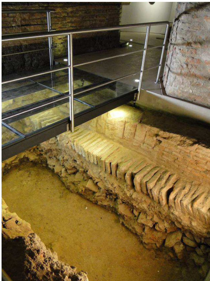
Figura 7. Musealización de la cuadrícula excavada en el sector del Fuerte de Buenos Aires que fue reutilizado, ubicado en el extremo sur del corredor de la galería. Se puede observar la hilera de ladrillos artesanales puestos de canto que servía de contención a un relleno conformado por restos de tipo doméstico.