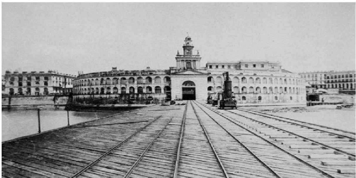
Figura 2. Fotografía de los depósitos de la Aduana Nueva o Aduana Taylor tomada desde el Río de la Plata, cuando ésta estaba en pleno funcionamiento.

En el año 1886 una ordenanza aprobó el proyecto de Eduardo Madero, para llevar a cabo la construcción del puerto. Las obras comenzaron en abril del año 1887, efectuando como tareas iniciales no solo el relleno de los terrenos que planeaban ser ganados al río, sino también la edificación de cuatro diques cerrados e intercomunicados que fueron construidos entre los años 1889 y 1897 (Obras Públicas 1889-1891).