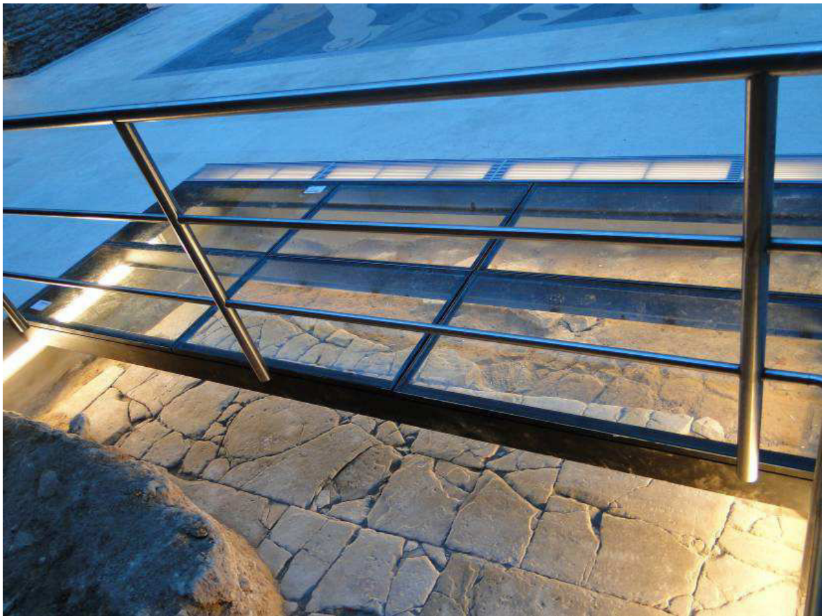
Figura 4. Musealización del sector en donde se halló el piso que tenía el patio de maniobras cuando este estaba en funcionamiento. Conformado por piedras lajas colocadas sobre dos capas de ladrillos de confección artesanal.

En este sector se decidió que los recursos utilizados para dejar expuesto in situ el sector del piso hallado incluiría dejar cubierto una parte de dicho sector con vidrio, con una rejilla de ventilación en uno de los lados, similar a las denominadas ventanas arqueológicas. En tanto que la otra parte permanecería abierta rodeada por barandas de acero para que pueda ser observado directamente pero impidiendo llegar a él. De esta manera, la abertura de un sector y la rejilla de ventilación en el otro extremo estaría permitiendo la circulación del aire, evitando así la condensación por debajo de la parte cubierta (véase Figura 4).