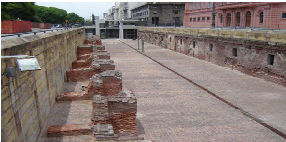
Figura 3. Estado de situación en el que se encontraba el patio de maniobras antes de iniciarse la obra y puesta en valor de la Aduana.

ubicaba hacia el lado este del patio, entre los 2-2,5 m de ancho y hasta 6 m de profundidad, implantando además una serie de elementos metálicos cuya función habría sido la de sostener el muro de bloques de hormigón, levantado a lo largo de toda la extensión del patio. Después de estas últimas intervenciones no se realizaron acciones de gran magnitud en el sitio, ingresando poco a poco dicho espacio en un estado de semi-abandono y cierto olvido (véase Figura 3).