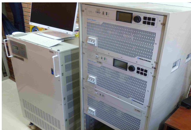
Figura 4: Simulador de rede CA (à esquerda) e fonte simuladora de arranjos fotovoltaicos (à direita).

arranjo fotovoltaico real, inclusive respondendo a variações dinâmicas de irradiância e temperatura de célula. A fonte possui um software de controle proprietário chamado SASControl , que permite programar ações de teste, verificar e registrar em tempo real o comportamento elétrico da entrada dos inversores, comportando a realização de ensaios estáticos com parâmetros fixos ou ensaios dinâmicos com parâmetros variáveis no tempo. Três fontes Regatron TopCon Quadro , com potências individuais de 16 kW foram associadas em paralelo, formando um cluster com potência nominal de 48 kW, permitindo simular curvas de arranjos com potência de até 45 kW, corrente de curto-circuito de 96 A e tensão de circuito aberto de 600 V. A Figura 4 apresenta a fonte simuladora de arranjos fotovoltaicos e o simulador de rede.