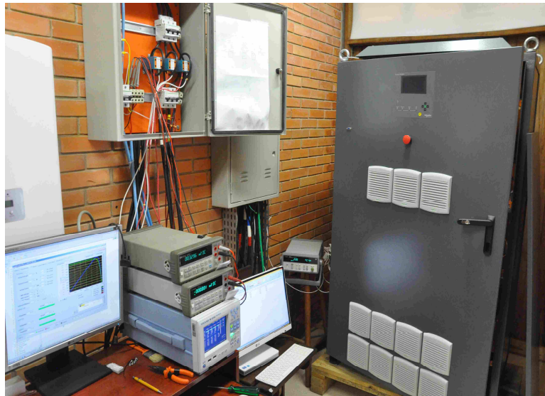
Figura 1: Vista parcial da bancada de testes de inversores.

A Figura 1 mostra uma vista parcial da bancada durante realização de testes iniciais de validação com um inversor trifásico de 50 kW a fim de caracterizar o seu comportamento térmico e desenvolver um modelo preditivo da temperatura de operação do inversor em regime transiente. A Figura 2 apresenta um diagrama de blocos com fluxos de energia entre os principais elementos da bancada de testes, enquanto que a Figura 3 apresenta um esquema de interligações elétricas da bancada de testes.