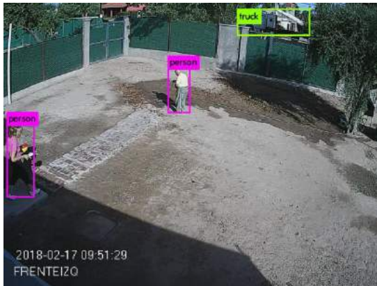
Ejemplo de detección de automóvil y persona