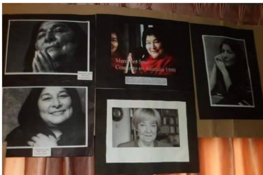
Imagen 2: Algunas de las figuras seleccionadas para la muestra fotográfica.

Con esta finalidad, nos propusimos redefinir al sujeto histórico. Pensamos que las propuestas del feminismo podían generar un verdadero cambio en la historias de vida. A su vez, en consecución con este fin, intentamos evitar su invisibilidad y constituir al “Otro como sombra del Yo” (Spivak, 2003, p. 20), poniéndose el foco en la mismidad. Por lo tanto, fue necesario que el sujeto subalterno tuviera “un espacio o una posición desde la cual pueda hablar” (Spivak, 2003, p. 3), para superar el pensamiento dicotómico y asimétrico que prima en el falogocentrismo. Estas voces que surgían no eran homogéneas ni únicas, sino heterogéneas y atravesadas por una multiplicidad de variantes (clase, etnia, región, orientación sexual). Las biografías de Bartolina Sisa Vargas, Juana Azurduy Bermúdez, Luisa Calcumil y Mercedes Sosa nos permitieron abordar estos cruces de categorías. A su vez, pudimos visibilizar que hay muchas realidades para las mujeres, es decir, no homologar mujer blanca a mujer (Mignolo, 2008). Por otra parte, hubo docentes que le dieron prioridad a lo local e indagaron en las mujeres que se habían destacado en el propio distrito.