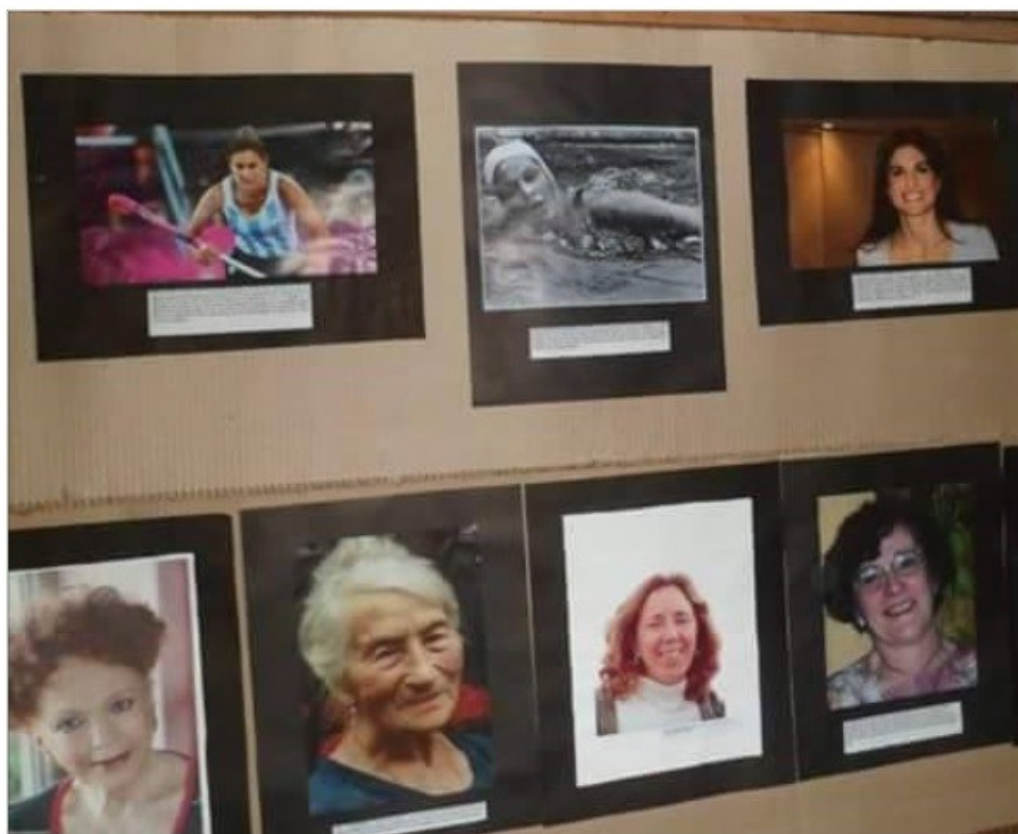
Imagen 1: Algunas de las fotografías de figuras estudiadas, ya montadas en la muestra escolar.

El segundo momento de este proyecto fue buscar, en diferentes medios de información, datos acerca de la vida de las mujeres elegidas para poder construir sus biografías en clases. Desde el mes de abril, les propusimos a las y los estudiantes la actividad que se plasmaría en el mes de julio. La misma fue realizada en los horarios de clase de la materia: una parte fue destinada al recorrido de los contenidos del programa de cada año y otra, para el desarrollo de esta actividad. Para lograr escribir a las biografías de las mujeres, las y los estudiantes indagaban en libros, en la web y en material que cada docente acercaba. Los materiales para la muestra (cartulinas, afiches, impresiones, alfileres) fueron solventado por lxs docentes de los cursos que estaban implicados en la muestra.