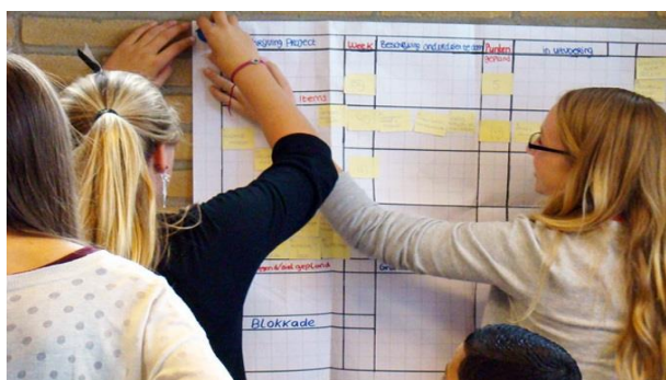
Figura 3. Alumnos trabajando en el tablero [22]

La hoja es una representación cronológica del trabajo del sprint que permite alcanzar los objetivos de aprendizaje, y las tareas y asignaciones se van moviendo de acuerdo a cómo van cambiando de estado: pendiente, ocupado y terminado - los alumnos mueven las tareas del panel todo (pendiente) al done (terminado) pasando por “in progress” (ver Figura 3).