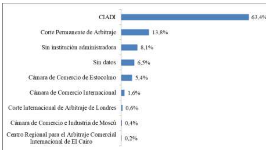
Gráfica 1: Instituciones administradoras de arbitrajes inversor-Estado. Porcentaje sobre número total de casos conocidos