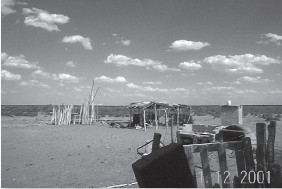
El paisaje natural...