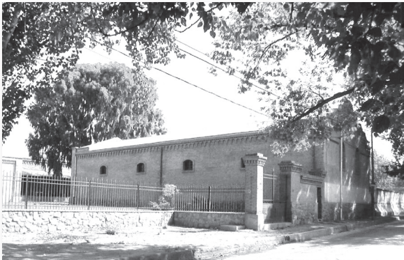
...el paisaje comienza a transformarse.