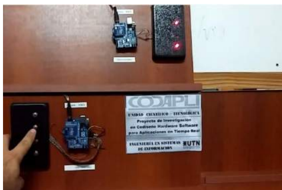
Fig. 2. Prototipo de sistema transmisor-receptor con módulos XBee desarrollado en el laboratorio

Las líneas de investigación se orientan principalmente en la búsqueda de alternativas más económicas y simples tanto en la comunicación inalámbrica entre los nodos como en su diseño y desarrollo. Una opción es el uso de la tecnología Arduino con sus placas de bajo costo y las posibilidades de interconexión vía WiFi a través de shields o módulos inalámbricos frente a las más costosas placas XBee que utilizan el standard Zigbee para la comunicación inalámbrica (Fig. 2). En aquellos sistemas que no requieran una gran cantidad de nodos ni el mayor consumo de energía sea un problema, puede resultar en una solución aceptable y de bajo costo [5], [6].