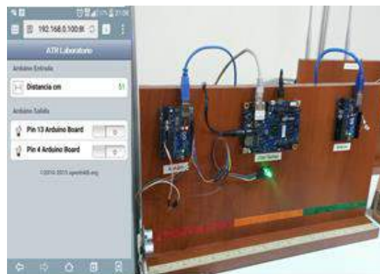
Fig. 3. Aplicación móvil para toma de datos y control de dispositivos físicos mediante combinación de placas Arduino-Intel Galileo.

Se ha experimentado y realizado prototipos de adquirentes de datos y comunicaciones inalámbricas utilizando diferentes tecnologías y plataformas: Arduino, Intel-Galileo, EDUCIAA (Fig. 3). Esto nos permite tener una cierta experiencia a la hora de evaluar diferentes implementaciones, especialmente en el tema de la comunicación inalámbrica sobre la red de sensores, tema principal del proyecto.