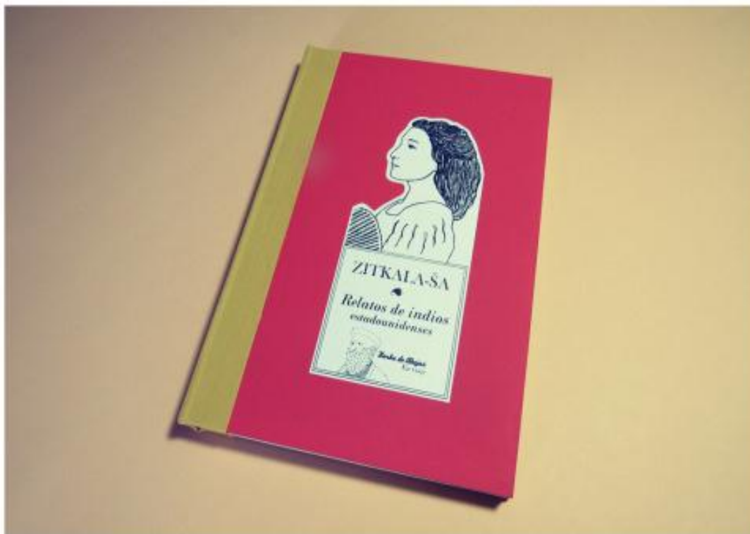
Imagen 7. Ejemplo de edición en cartóné. Relatos de indios estadounidenses (2015), de Zitkala-Sa, editado por Barba de Abejas.

doble papel como guarda. La edición en cartóné (Imagen 7), varía en el grosor del cartón que esta vez es de 3 mm. Asimismo, presenta tapas pintadas a mano en acrílico, así como contratapa en cartón crudo y cartón entelado. Volvemos a encontrar la viñeta en la tapa y el sello tanto en contratapa como en el lomo.