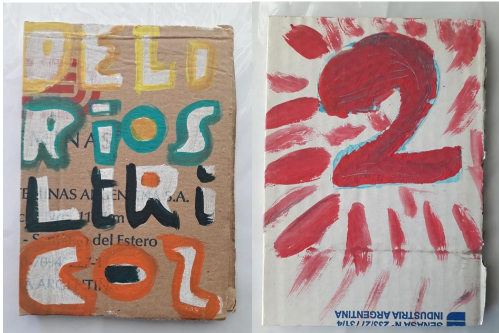
Imagen 4 (Izquierda) Tapa del libro Delirios líricos , de Glauco Mattoso, editado por Eloísa Cartonera. Imagen 5 (Derecha). Tapa del libro Vivan los putos . Tomo 2. Varios autores, editado por Eloísa Cartonera.

Como es posible apreciar en el ejemplar de Glauco Matoso, la estridencia de colores se acompaña de un cartón cuya procedencia es eminentemente callejera. Este último rasgo evidencia el proceso productivo que ha transitado el cartón antes de desplegarse como un libro, así como las técnicas de las que ha sido objeto: recolección, reutilización, encolado, pintado a mano. En este punto, la referencia a “República de La Boca” constituye una mención en principio abstracta, pero que podría ser una referencia a un alzamiento de independentistas italianos en La Boca hacia 1882 18 . Invocar tal circunstancia refuerza la idea de trabajo autónomo y cuentapropista, cuestión que aparece continuas veces en el discurso de los integrantes de Eloísa Cartonera. Asimismo, el barrio de La Boca -ubicado al sudeste de la Ciudad de Buenos Aires- presenta un paisaje urbano constituido por el espacio portuario y los viejos conventillos y pensiones, así como una trama cultural enlazada con la inmigración, el tango y el lunfardo. Estos elementos parecen explicar por qué Eloísa Cartonera afirma su identidad como proyecto no sólo por su actividad editorial, sino también mediante la específica ubicación espacial que se encarga de resaltar.