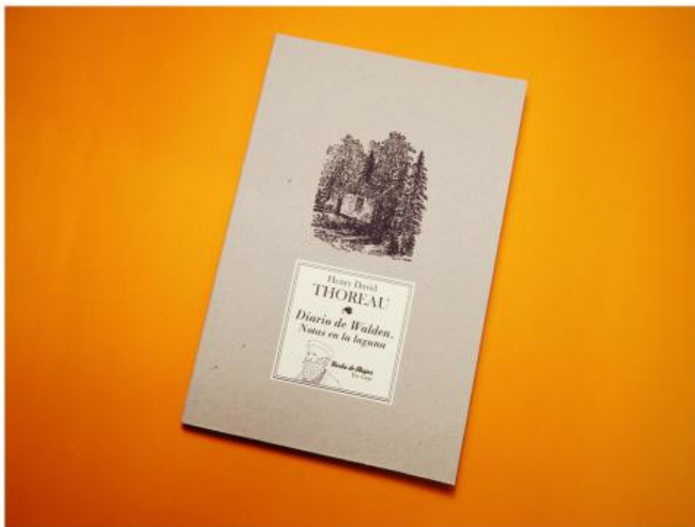
Imagen 6. Ejemplo de edición en rústica. Diario de Walden de Henry David Thoreau, editado por Barba de Abejas.

que todos los libros comparten un papel bookcel (ahuesado) de 80 grs, con una impresión láser -“hogareña”, como él mismo se encarga de subrayar- en cuadernillos perforados, plegados, cosidos y refileados. Los detalles de encuadernación también son descritos minuciosamente en la página web de la editorial: papeles de guarda coloreados a la masa de \pm 150 grs; sellos en interiores; señalador con grabado y calado, también numerado.