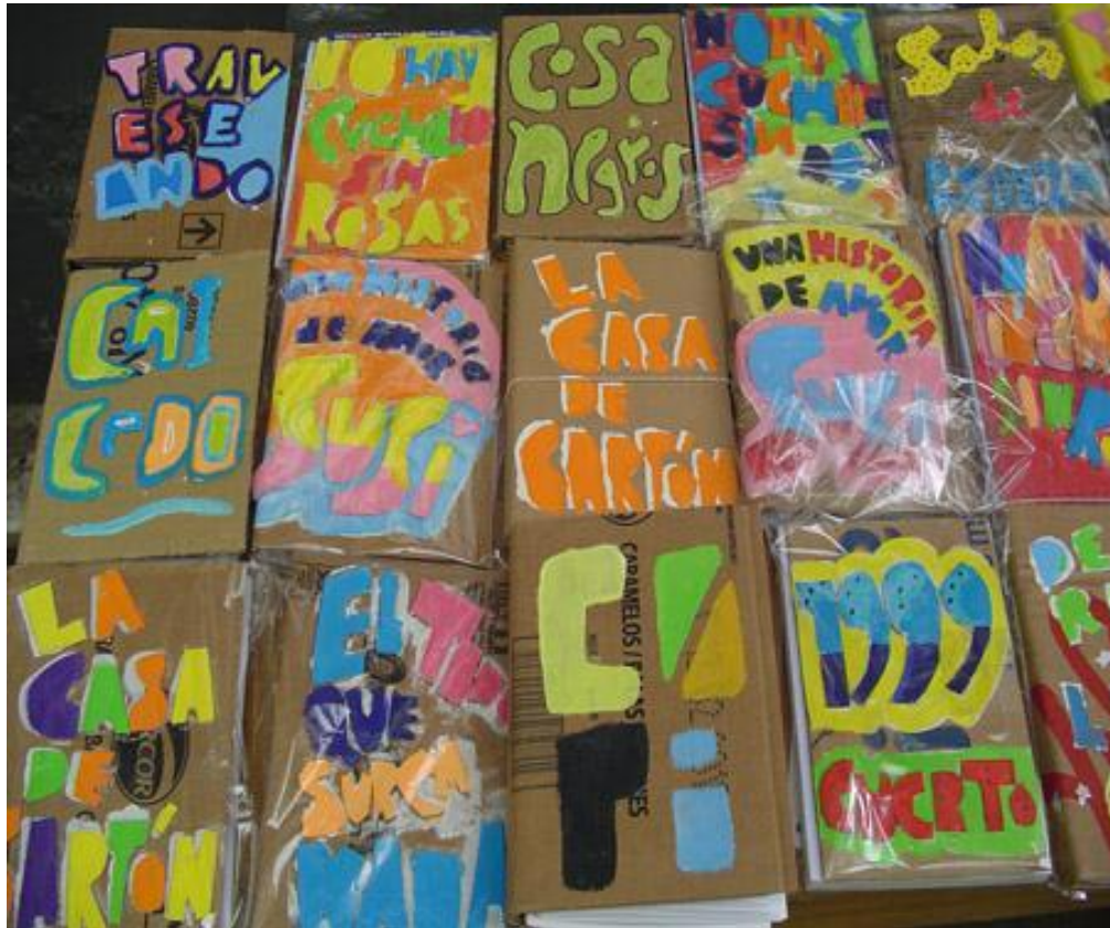
Imagen 1. Libros de Eloísa Cartonera dispuestos sobre un escritorio del taller.

No obstante lo dicho, afirmar que no existe una imagen a la cual el libro deba acercarse, no implica que los libros de Eloísa Cartonera no posean todos una estética general que los asemeje y permita reconocer a cada uno de ellos como pertenecientes a la editorial. En todos los casos pude corroborar la utilización de témperas de colores saturados y estridentes –amarillos, rojos, naranjas, azules, verdes-. Las letras que forman los paratextos de las tapas son grandes, articuladas en formas enormizadas y voluptuosas, que se cortan y fraccionan y por tanto permiten pocas palabras por cada tapa. Un aparente efecto de tridimensión parece expresarse con el relleno de blanco en los contornos de letras, que roza lo paródico y el kitsch 15 .