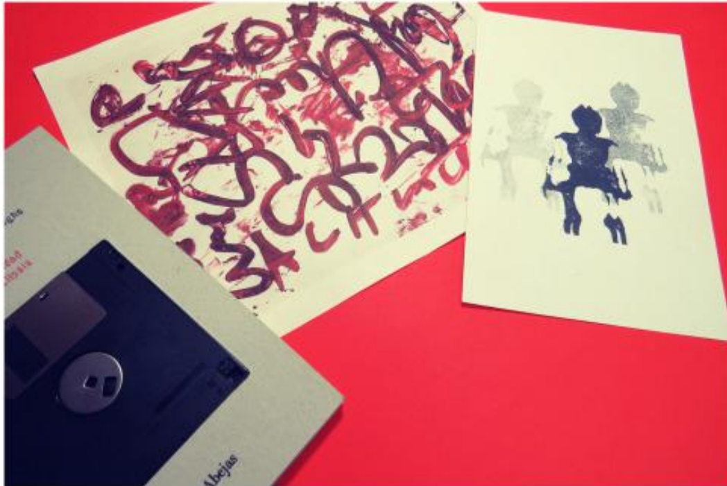
Imagen 9. Inmortalidad y apocalipsis , de William Borroughs, editado por Barba de Abejas.