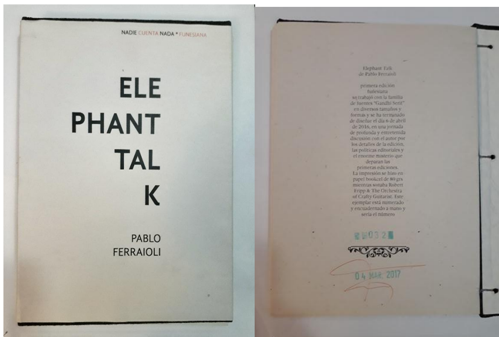
Imágenes 11 y 12. Elephant talk , de Pablo Ferraioli, editado por Editorial Funesiana.