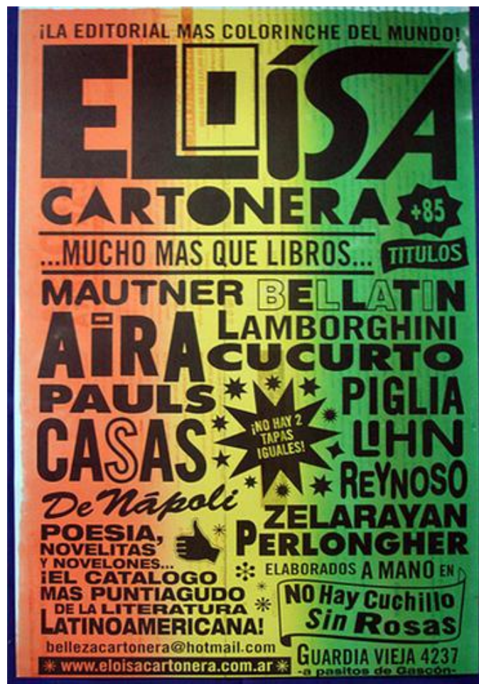
Imagen 3. Estilo de afiches distribuidos por Eloísa Cartonera.

Tal como venimos diciendo, en Eloísa Cartonera, la saturación de colores sobre un cartón que no se termina de recubrir, generando una factura que deliberadamente abandona toda prolijidad, no implica otra cosa que anclarse a un imaginario de rusticidad, de precariedad. Así, como mencionamos anteriormente, es posible pensar en estos libros cartoneros la existencia de una estética semejante a la de los afiches que suelen colgarse en las paredes de barrios como La Boca o Almagro, o en el interior de la provincia de Buenos Aires (Imagen 2). En ellos se promociona a determinados cantantes o grupos de cumbia que se presentarán en galpones o bailantas. Estos carteles se suelen imprimir en papel afiche con una superficie de un metro cuadrado, se pegan sobre los muros mediante el encolado, y generalmente constan de un fondo de algún color primario, o una variedad de estos, y letras negras. Se formula así un efecto de espectacularidad o de magnificencia tendiente a resaltar la especialidad de la fecha en la que el artista se presentará. De alguna manera, apuntan a producir con herramientas más accesibles aquello que los teatros y cines hacen con sofisticación desde los carteles y marquesinas de las