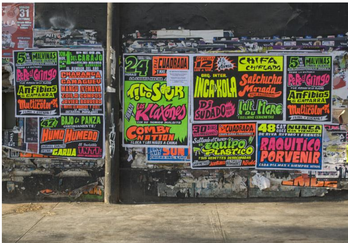
Imagen 2. Estilo de afiches que promocionan eventos de cumbia en ámbitos públicos urbanos. Ciudad de Buenos Aires, noviembre de 2009.

trayecto de la edición, el texto original es recubierto por un tratamiento plástico referenciado a la cultura suburbana de Buenos Aires: los afiches callejeros, los materiales perecederos, los carteles de las bailantas (Imagen 2). En tal sentido, a los libros “cartoneros” les cabe dicha denominación también en virtud de un acabado estético que perfecciona tal adscripción simbólica.