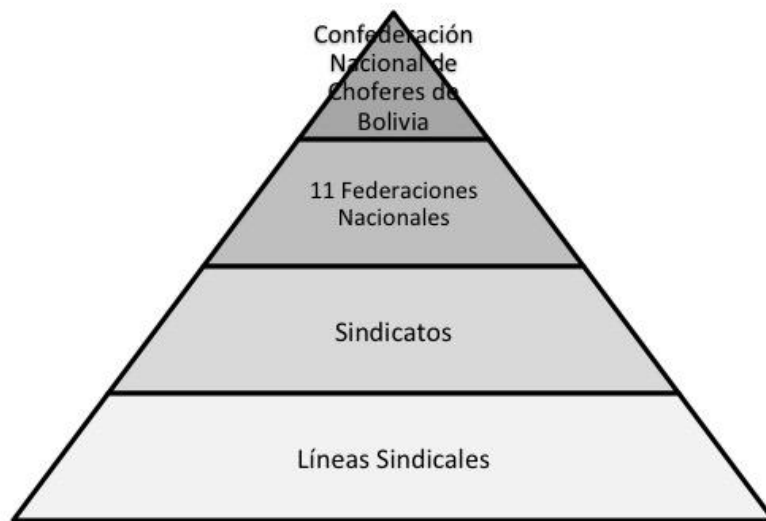
Figura N° 2. Estructura organizacional de la Confederación Nacional de Choferes de Bolivia.

hay un esquema de respeto en el sindicalismo del transporte. Los sindicatos no están subordinados a la Confederación pero sí dependen de las Federaciones Departamentales, hay respeto por los estatutos que son aprobados por todos, incluso las bases. Se respeta la jerarquía y hay elecciones internas, quienes tienen mayores posibilidades van a voto, tanto en las Federaciones como en la Confederación (entrevista código B2).