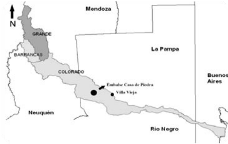
Figura 2. Ubicación geográfica de Villa Vieja (Dpto. Puelén, La Pampa), sitio de muestreo.