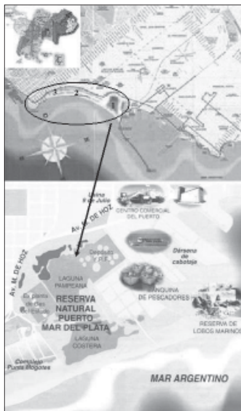
Figura 1. Ubicación del área de estudio. El óvalo muestra el complejo de lagunas costeras del Puerto y Complejo Balneario Punta Mogotes. La flecha indica la Reserva Natural del Puerto Mar del Plata. Los números 1, 2 y 3 señalan la ubicación de las estaciones de muestreo (modificado de Subsecretaría de Medio Ambiente, Municipalidad de General Pueyrredon, Reserva Natural del Puerto Mar del Plata).

La ciudad de Mar del Plata está ubicada sobre el litoral atlántico bonaerense a los 38° 02' 40" S y 57° 32' 00" O. Situado inmediatamente al sur del puerto de Mar del Plata se encuentra el complejo de lagunas y humedales del Puerto Mar del Plata y Punta Mogotes (Figura 1), las cuales se