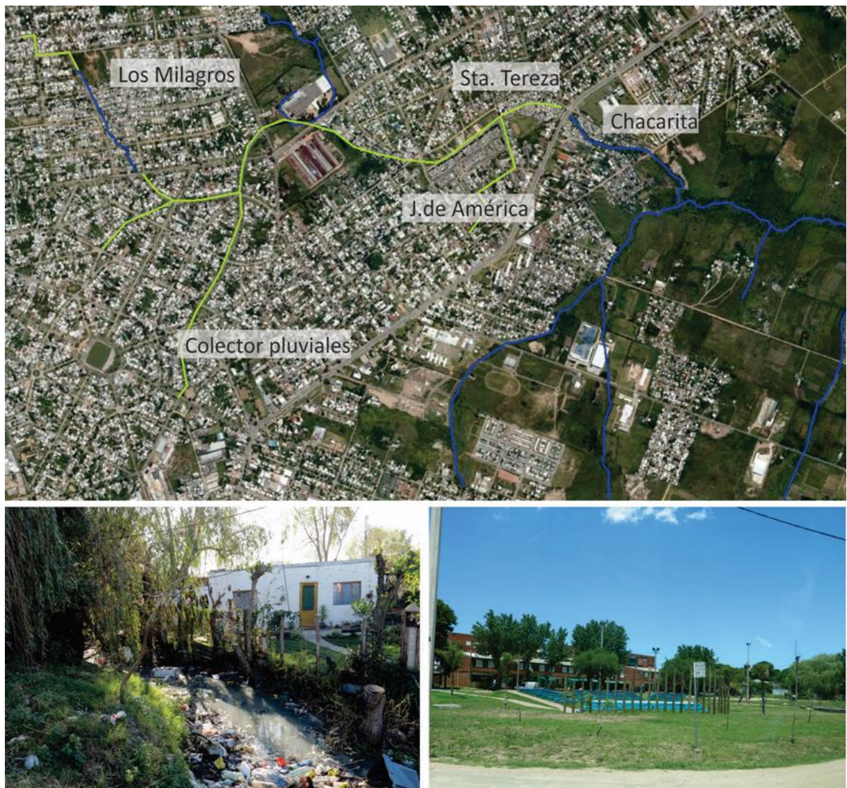
Fig. 1. Cañada de la Chacarita. Proceso de completamiento urbano con tramos entubados (amarillo) y a cielo abierto (azul) (imagen 2016). Asentamiento Los Milagros (nacientes), Cooperativa Juana de América (tramo medio, espacio público sobre arroyo entubado).

La Facultad de Arquitectura, Diseño y Urbanismo (FADU-UdelaR) articula sus actividades con estos procesos, aportando desde diferentes instancias. La Cuenca de la Chacarita se adopta como ámbito de trabajo para “Mayo Sustentable”, actividad que planteó durante mayo de 2017 promover espacios de reflexión e intercambio sobre hábitat, ambiente y sustentabilidad. En particular se desarrollan tareas de extensión y enseñanza (coordinadas con el Programa Integral Metropolitano de la Universidad) como los cursos Agua-Ciudad / Ciudad-Agua 1 y Transversal Sustentabilidad 2 en los que se generan intercambios y diálogos con diversos actores locales e integrantes del Consejo y cuyos productos son puestos a disposición de los actores locales.