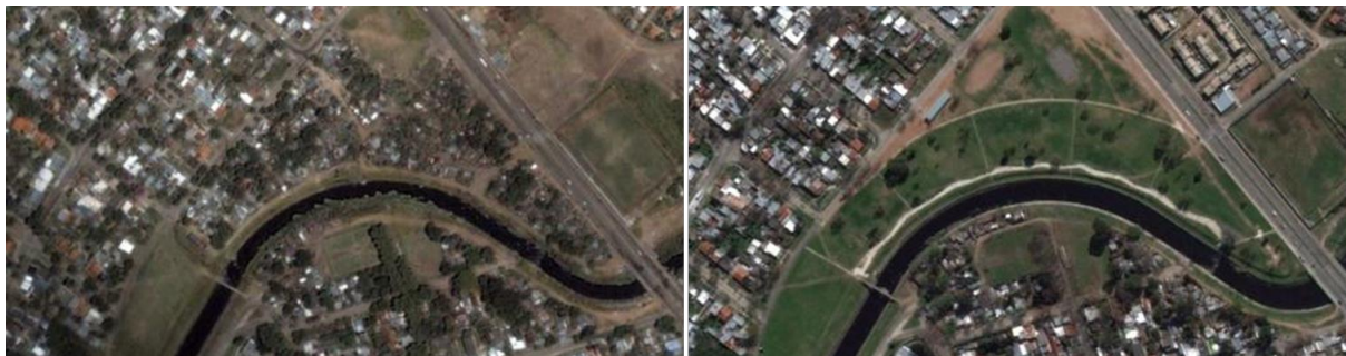
Fig. 3. Relocalización y parqueización asentamiento 25 de agosto. Propuesta a partir de concurso público

El Plan Especial del Arroyo Miguelete (IM, 2004) aporta una mirada integral al curso, reconociendo las particularidades de los sectores urbanos que atraviesa y puntos estratégicos que reconocen la vinculación del arroyo con las conectividades urbanas principales. El espacio público y su materialización en un “parque lineal” se constituyen en la idea fuerza que unifica la propuesta y permiten el progresivo desarrollo de la misma. Otros instrumentos de ordenación como el Plan Parcial Casavalle mencionado anteriormente se articulan al Plan Miguelete incorporando cursos tributarios menores como la Cañada Matilde Pacheco.