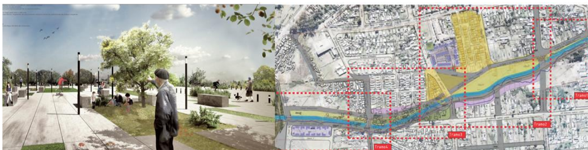
Fig. 2. Cañada Matilde Pacheco. Proyecto urbano en el marco del Plan Casavalle. Propuesta ganadora del concurso de estudiantes (Alonzo, Egaña)

En este contexto en el año 2015 la FADU centra diversos trabajos sobre la Cuenca Casavalle, en particular desarrolla el Seminario “Pasajes” con participación de docentes extranjeros en el marco del cual se convoca a un concurso de estudiantes en el futuro punto de cruce de la calle Montes Pareja incluyendo el espacio público y la conectividad peatonal entre ambas márgenes.