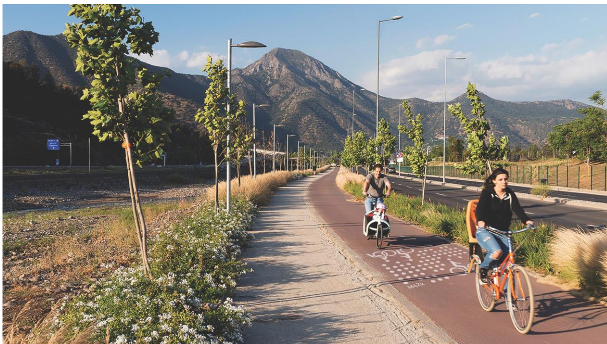
Fig.7 Cicloparque Mapocho 42K en Tramo Oriente

Haciendo eco de las palabras del ecólogo Richard Fordman, quien postula que la ciudad debiera ser pensada para personas entre los 7 y los 70 años”, el Cicloparque propuesto se relaciona a partir de su emplazamiento y componentes, con los atributos de un corredor de movilidad sustentable o Via Verde, capaz de acoger a partir de sus componentes, distintos tipos de usuarios en un espacio de seguridad y cercanía con el entorno circundante.