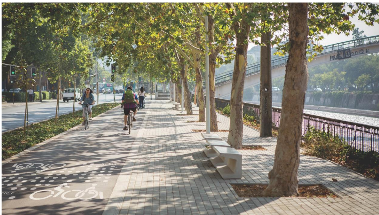
Fig.8 Cicloparque Mapocho 42K en Tramo Central

La segunda etapa –desarrollada desde inicios del 2013 hasta ahora-, ha contemplado la propuesta de diseño e ingeniería de detalles para el Cicloparque Mapocho 42K, considerando una selección de 7 tramos a lo largo de los 42 km, de tal manera de restituir una primera conectividad de casi 20km. Durante esta etapa se delinearon los criterios de diseño comunes para todo el recorrido, estableciéndose dos conceptos claves para una definición espacial del proyecto: por un lado, aprovechar la posición de balcón urbano abierto a la geografía como un atributo esencial a lo largo de la ribera, y por otro lado la condición de un corredor arbolado continuo, bajo cuya sombra se sitúa tanto el paseo peatonal como la senda ciclable, y que se presenta como elemento identitario del recorrido, así como desde el margen norte del río (Fig. 8).