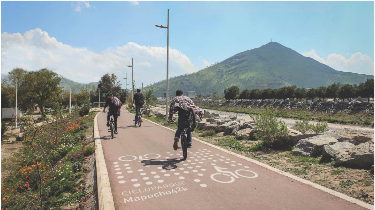
Fig.5 Cicloparque Mapocho 42K en Tramo Poniente

estratos sociales y topográficos, restituyendo una vocación de continuidad a lo largo del Río en oposición a la fragmentada división administrativa de sus riberas 18 . MAPOCHO 42K propone a partir de este recorrido público, que la conectividad geográfica se transforme en un atributo de equidad social para la ciudad (Fig. 5).