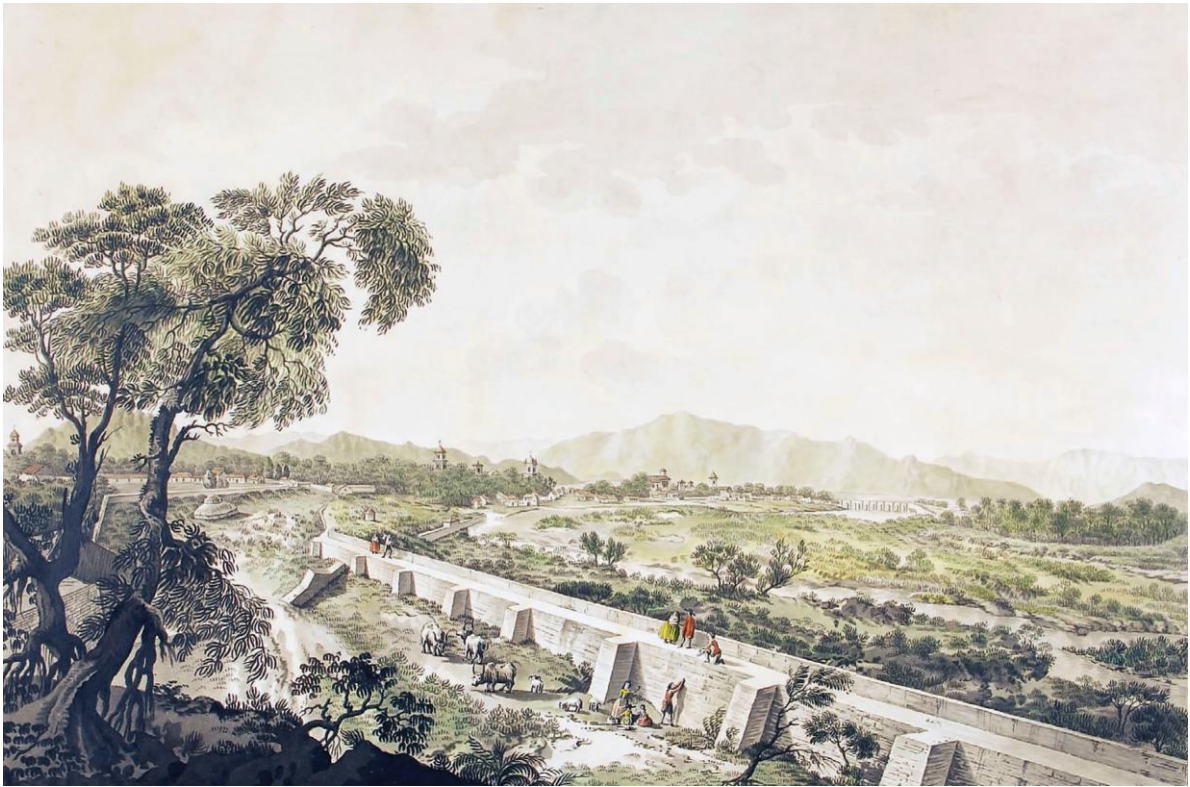
Fig.2 Vista de la ciudad de Santiago de Chile con parte del tajar del Río Mapocho. Imagen de Fernando Bambrila (©Museo Histórico Nacional)

Más tarde, a partir de las obras de canalización del río -en los albores del Centenario, se consolidaron en sus márgenes los primeros parques urbanos, que resultan hasta hoy exponentes destacados de recuperación de las riberas como espacio público para la ciudad: el parque Forestal y más tarde el parque Providencia, incorporaron una rica relación con el paisaje del río 9 .