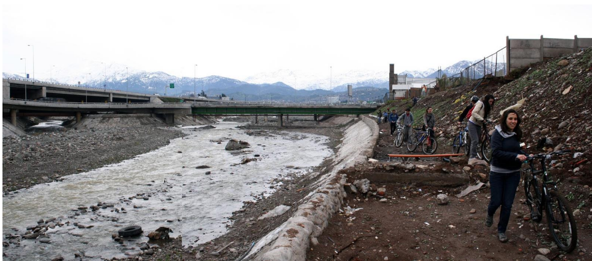
Fig.3 Itinerario a través de las riberas del Río Mapocho, Agosto 2009

En contraste con la continuidad conseguida por una vialidad expresa en la ribera norte, la primera premisa consistió en poner a prueba el potencial de un recorrido continuo a lo largo de la ribera sur, que permitiera integrar el paisaje de río al interior de la ciudad. Para ello se realizó un itinerario en bicicleta, que al poco tiempo del trayecto significó tener que sortear un sinnúmero de dificultades y situaciones que interrumpían sus bordes o lo hacían francamente inaccesible: cruces de autopistas, asentamientos informales, sitios eriazos, ensanches de vialidad, ocupación con programas restrictivos, y un conjunto de barreras existentes aún en los sectores consolidados 12 (Fig. 3).