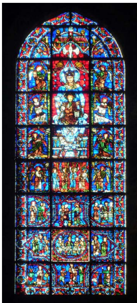
Figura 2. Vidriera de La Belle Verriere (1194), Catedral de Chartres, Francia

la imagen se completaba con un fondo geométrico tipo mosaico o vegetal con fondos o cenefas (Nieto Alcaide, 2011). Como ejemplo de esta época podemos nombrar las catedrales de Saint Denis, Chartres y Saint Chapelle, íconos de las vidrieras francesas (Norberg-Schulz, 1999).