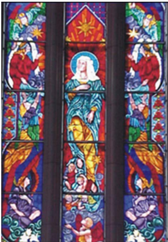
Figura 3. Vitral de la Virgen (1995), Catedral de La Plata, Argentina