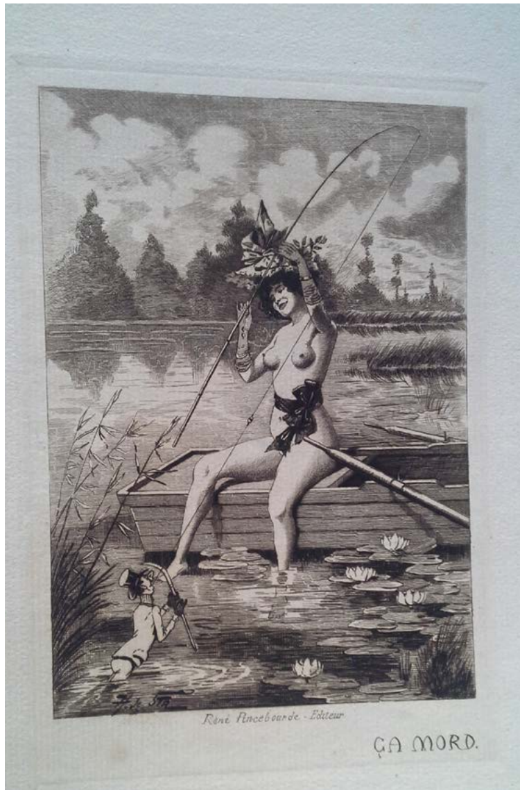
Figura 2. Pica (fechaada entre 1846 y 1920), Henry De Sta. Litografía, 11,5 x 16, 5 cm. Perteneciente a la Biblioteca Nacional Mariano Moreno