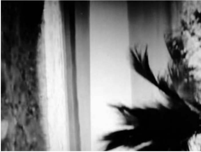
Fotograma de Andrea

Por ejemplo, un momento de desarrollo del film muestra un horizonte costero del mar, en forma vertical; pedí que expresamente viéramos cómo la audiencia intentó “normalizar” la situación de la secuencia inclinando la cabeza para que coincidiera con lo aprendido.