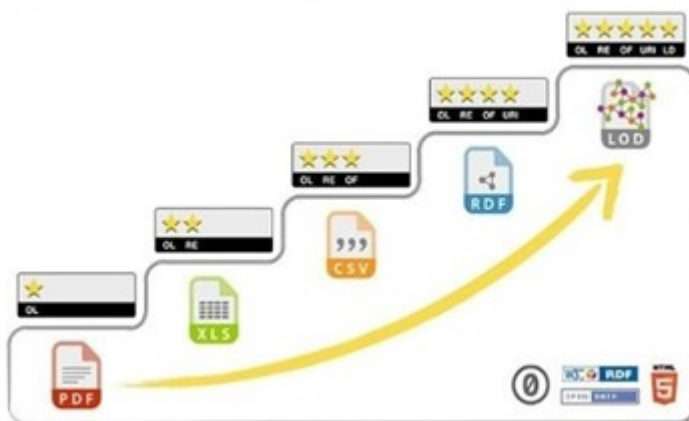
Figura 1 – Ranking “5 estrellas” para publicación y conexión de datos

Berners-Lee (2006) ha compilado el ranking de 5-star Linked Open Data para la evaluación de los datos publicados. La vista de ranking se muestra en la figura 1.