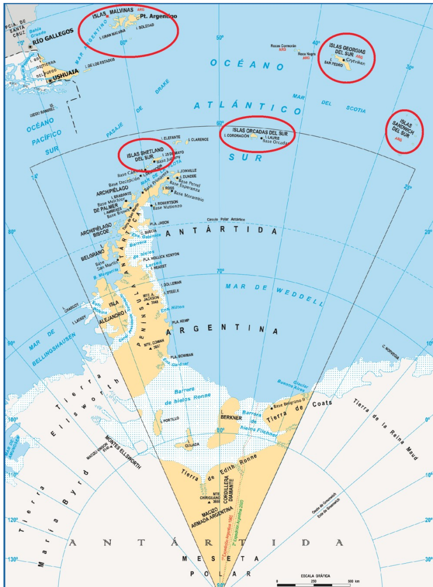
Figura N° 2 – Complejo sistémico: Malvinas, Islas del Atlántico Sur y Antártida.

La particularidad de los territorios al sur del paralelo 60°S es que se encuentran afectados por el Tratado Antártico. Esto incluye no sólo a la Península Antártica sino también a los archipiélagos de Orcadas y Shetland del Sur. El Tratado de 1959 ha “congelado” todos los reclamos territoriales en favor de la cooperación internacional en investigación y desarrollo científico, intentando perseguir el objetivo de mantener al continente como una zona de paz. Sin embargo, esto no quita la posibilidad de analizar algunos factores a la hora de pensar y planificar el futuro del Atlántico Sur Occidental.