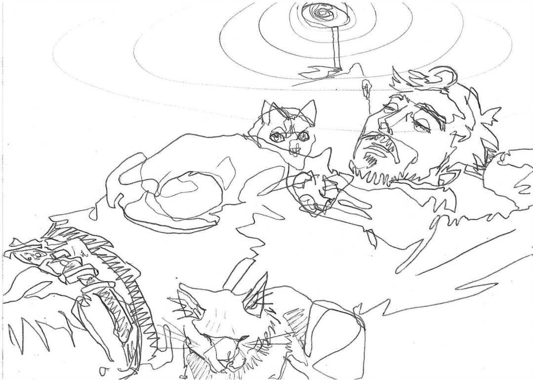
Dibujo 1 - Quemar