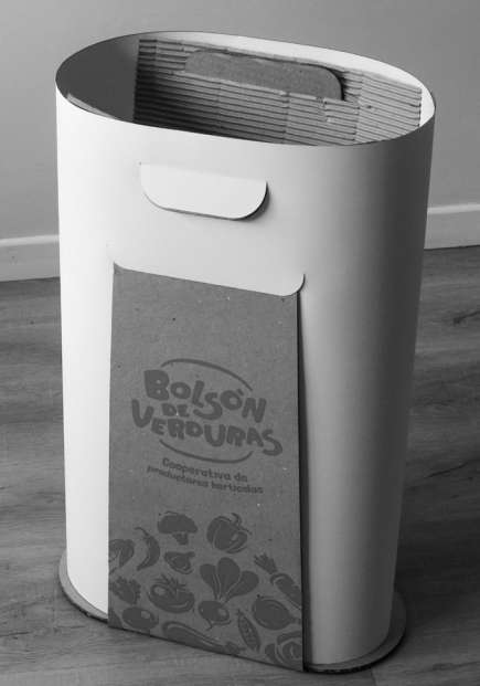
Envase armado, listo para llevar con verdura