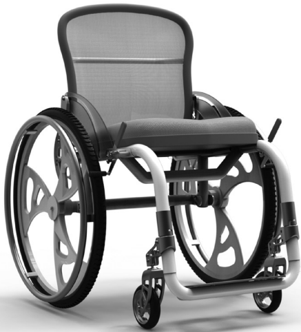
Vista principal delantera