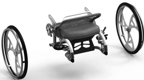
Configuración final del plegado