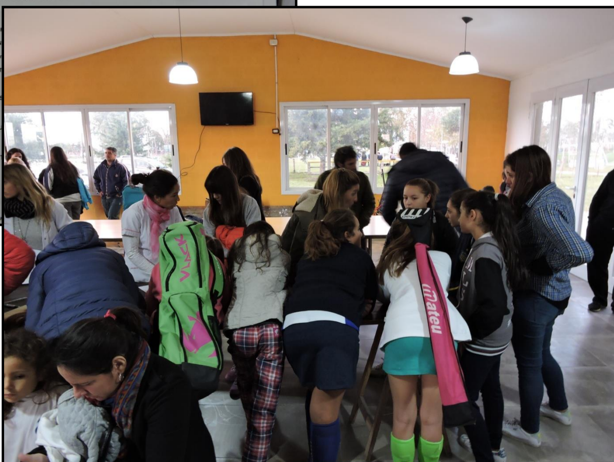
Fig. 1 y 2 Realización de encuestas a la comunidad