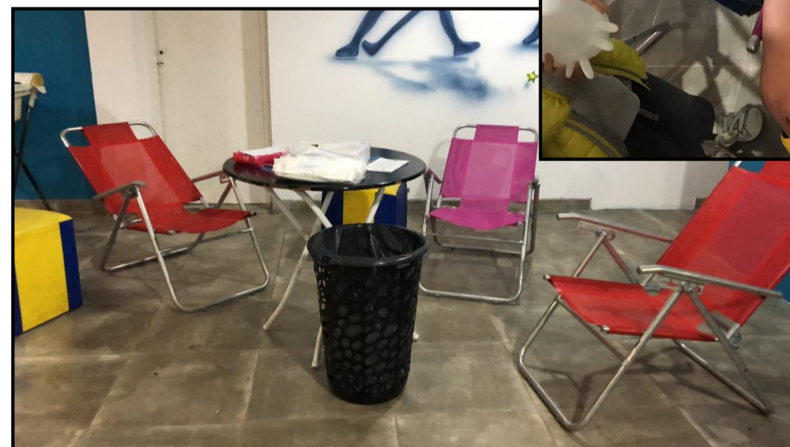
Fig 4,5 y 6 :Confección de fichas de registro clínico para diagnostico de maloclusiones.