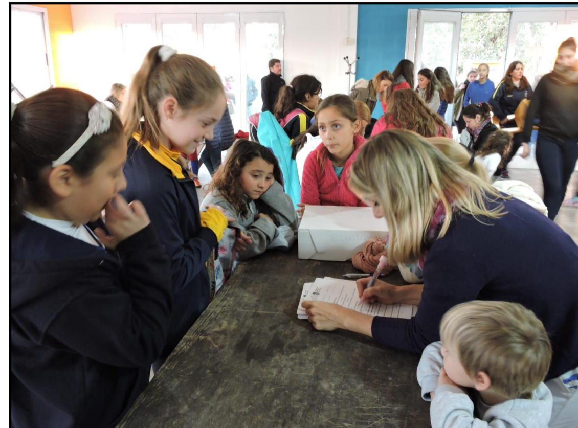
Fig. 3 Encuestas

Otro de los métodos de recolección de datos consistió en la inspección clínica de las niñas y adolescentes jugadoras de hockey. Los datos obtenidos fueron registrados en fichas diseñadas para posteriormente tabular dichos datos y poder abordar al diagnóstico de maloclusiones e informar a los padres de la necesidad de tratamiento de sus hijos.