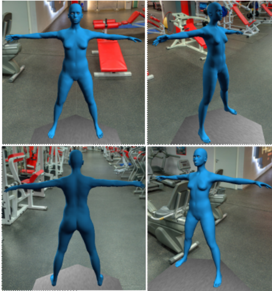
Fig. 1. Reconstrucción 3D a partir de una secuencia de fotogramas.

adquisición, al ser muy sencillo, puede ser realizado por el paciente, y al subirse los datos a la nube, pueden ser analizados por el especialista a distancia.