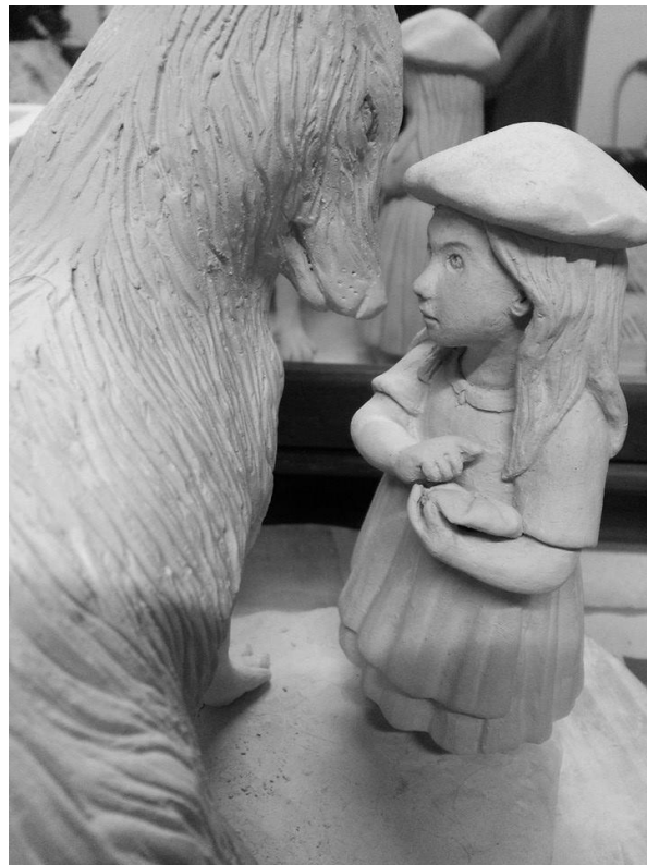
Work in progres

Comencé el proyecto buscando imágenes, ilustraciones, fotos, películas, esculturas de otros artistas, todo lo que pudiera ayudarme en la composición y recursos utilizados. Cada pieza la modelé en arcilla.