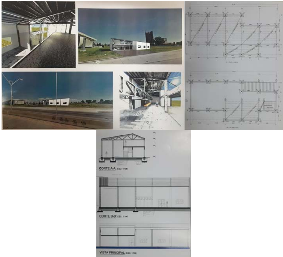
Fig. 8 a 10 – Ejemplos de Trabajos Prácticos n° 2.