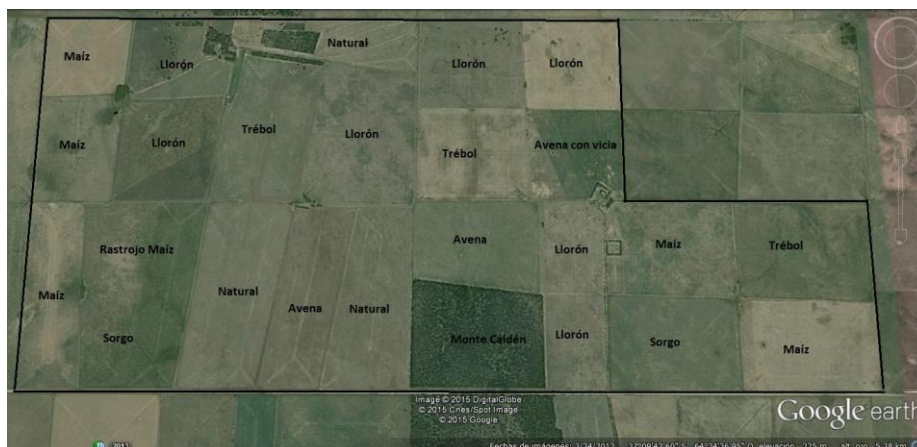
Fig.1. Establecimiento San José. División por lote y uso del suelo.

Según [12], la zona de emplazamiento del predio bajo estudio corresponde a la subregión de las mesetas y valles dentro de la Región oriental. Las precipitaciones fluctúan de 600 mm noreste a 450 mm en el suroeste, constituyéndose este parámetro meteorológico en uno de los factores limitantes más importantes en el comportamiento de la vegetación en ambas zonas. Los suelos, predominantemente arenosos, con presencia de limo, determinan el uso preponderante para la actividad ganadera extensiva.