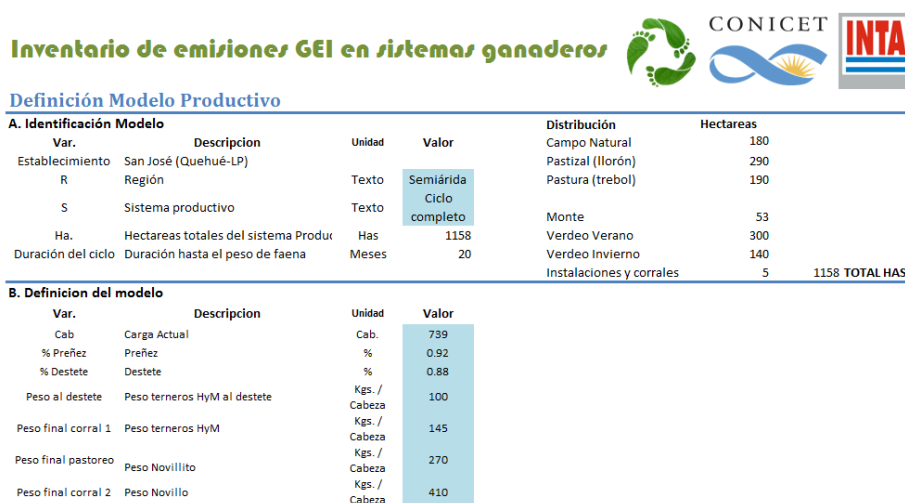
Fig.3. Pantalla de la planilla de datos para definir el sistema productivo.

La planilla adaptada de [9] contiene tres hojas: la primera donde se ingresan los datos y otras dos de resultados. En una hoja se muestran los cálculos a nivel de categoría bovina y en la otra a nivel de hectáreas (figuras 3 a 6).