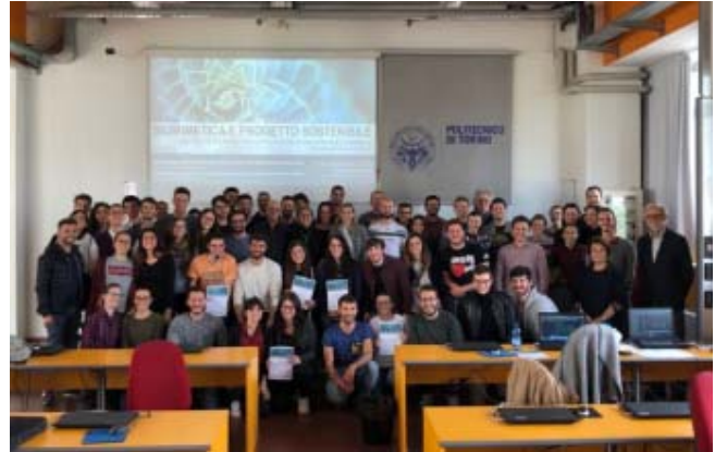
Fig. 4. Trabajo en clase. A la izquierda estudiantes trabajando en sus proyectos de aplicación de los conceptos de biomimética. A la derecha fotografía del cierre de actividades y entrega de certificado a los participantes.