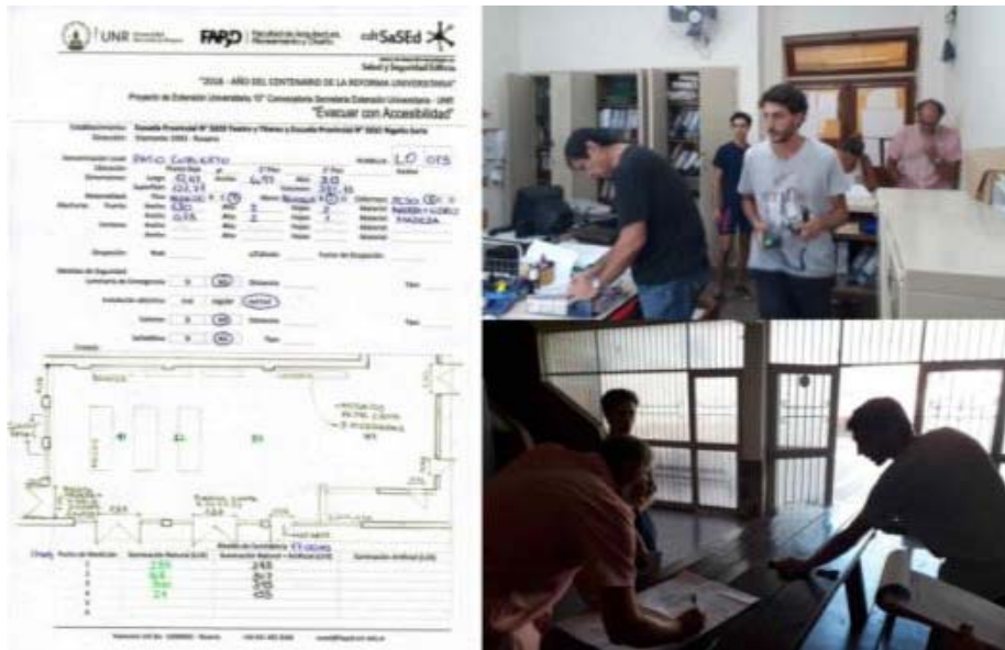
Imagen 03 y 04 – Planillas de Relevamiento

Se construyó para la toma de datos, una de Planilla de Relevamiento con: denominación local, ubicación, dimensiones del local, aberturas, puertas y ventanas, materialidad y tono -piso, muros y cielorrasos-, ocupación real e ideal, factor de ocupación, si poseían medidas de seguridad -luces de emergencia, condición de la instalación eléctrica, cercanía a extintor, señalética, niveles de iluminación -natural, natural + artificial y artificial- con croquis representativos del local.