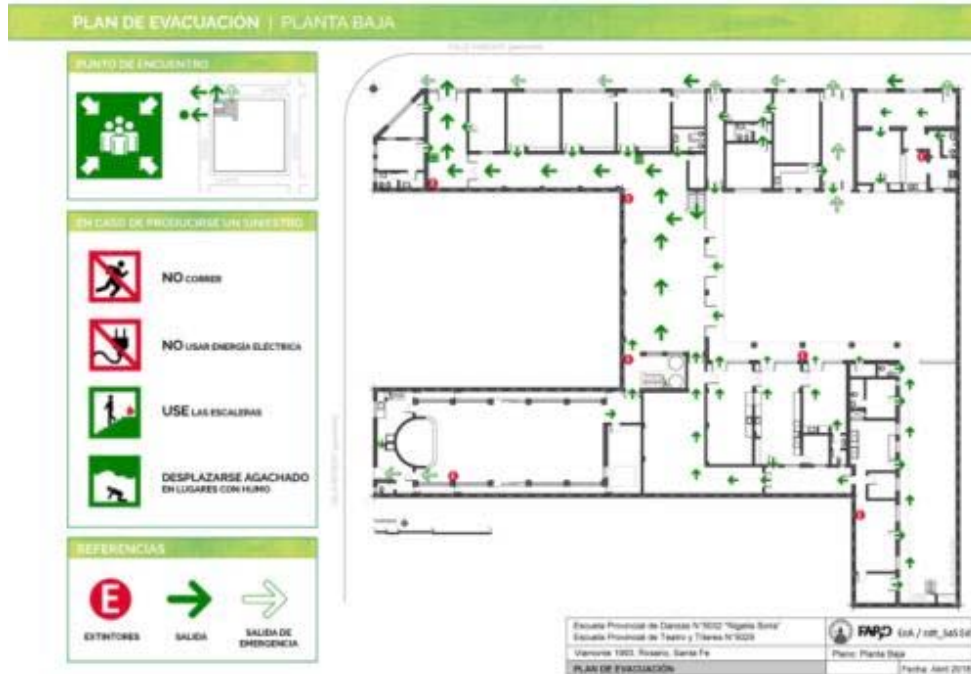
Imagen 08 y 09 - Geometrales del Plan de Evacuación.

Quedan dos meses para terminar la planificación del proyecto de extensión, que consiste en el cuarto encuentro con las Contrapartes para realizar las siguientes actividades: 1) Jornada de instalación y colocación de la señalética, equipos extintores, provisión de botiquín de primeros auxilios y luces de emergencia, 2) Capacitación del personal de apoyo en la comprensión del Plan de Evacuación y determinación de los responsables brigadistas junto a otra capacitación en manejo de extintores a realizarse en el cdt_SaSEd, y 3) para finalizar con un Simulacro de Evacuación, que será evaluado mediante un informe, considerando el análisis de las condiciones del inmueble, identificación de riesgos, análisis del tipo de riesgo, reducción de los riesgos, determinación de la población del inmueble, rutas de evacuación, salidas de emergencia, señalamiento, tiempo de desalojo 2° piso, tiempo de desalojo 1° piso, tiempo de desalojo Planta Baja, tiempo de desalojo a Punto de Encuentro, áreas de seguridad internas y externas, tránsito por el edificio, actuación de los encargados de piso, Procedimiento de evacuación, difusión del simulacro, alarma, comportamiento de brigadas /encargados, comportamiento de evacuados según las calificaciones excelente, muy buena, buena, regular, mala y cantidades personas evacuadas por tiempos de sectores.