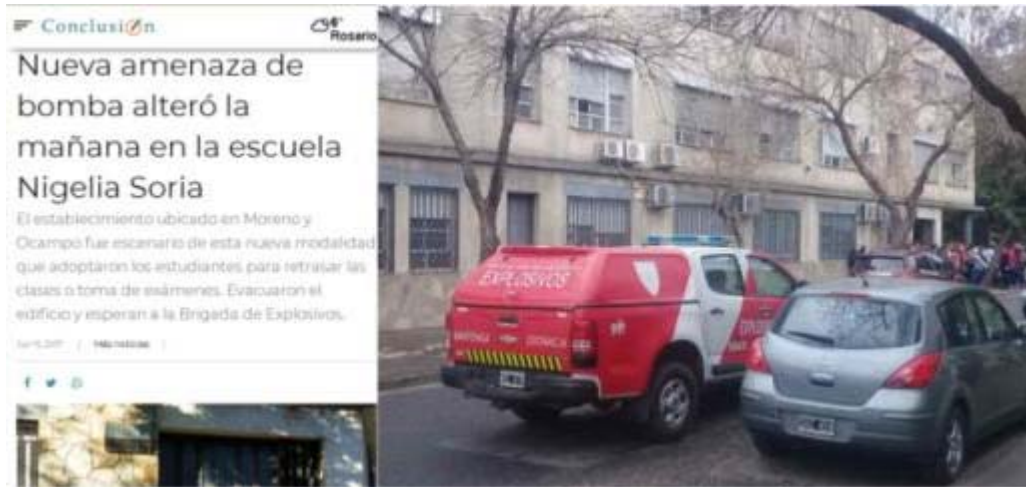
Imagen 01 y 02 – Capturas de pantalla de noticias año 2017 sobre la Escuela Nigelia Soria

perturbaron a la comunidad educativa varios llamados por amenaza de bombas y desprendimiento de luminaria que lastimaron a alumnos.