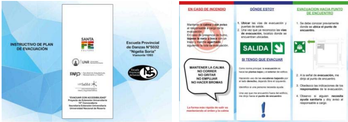
Imagen 05 y 06 - Propuesta Tríptico, Pautas para Evacuar un Establecimiento Educativo

Para cuantificar los equipos -extintores- necesarios y la señalética requerida se recurrió a generar planos utilizando el protocolo de puntas y gráficas preestablecido por el cdt_SaSEd.