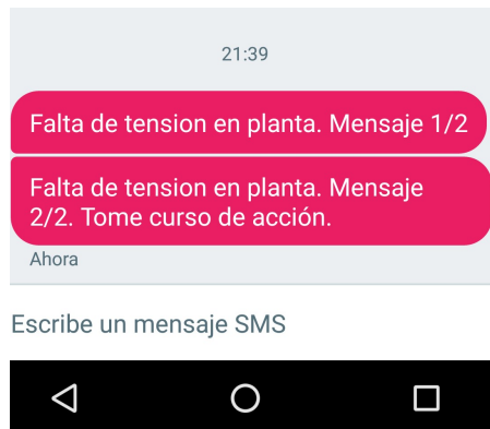
Fig 8. Captura de mensajes enviados desde Arduino.

Para el caso de tomar un curso de acción, (en este caso el encendido/apagado del generador a distancia), se simuló a través de un led conectado al relé de salida de la placa, destinado a la puesta en marcha del grupo electrógeno. El proceso consistió en el envío de un sms a la placa, con el texto “Encender” o “Apagar”. Mediante la pro-