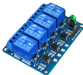
Fig 4. Bloque integrado de 4 relés 230V/5V dc

El relé es un dispositivo electromagnético. Funciona como un interruptor controlado por un circuito eléctrico en el que, por medio de una bobina y un electroimán, se acciona un juego de uno o varios contactos que permiten abrir o cerrar otros circuitos eléctricos independientes.