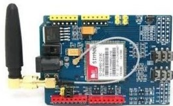
Fig 3. Shield GSM/GPRS SIM 900

El relé es un dispositivo electromagnético. Funciona como un interruptor controlado por un circuito eléctrico en el que, por medio de una bobina y un electroimán, se acciona un juego de uno o varios contactos que permiten abrir o cerrar otros circuitos eléctricos independientes.