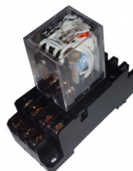
Fig 5. Relé 230V 50/60 Hz sobre zócalo