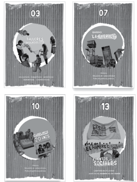
Figura 3 Revista La Casita de Colores N.º 1 (2017)

Por otra parte, se llevó a cabo una campaña comunicacional enmarcada en el vigésimo aniversario de la organización, proponiendo un sistema de promoción externo que pudiera englobar distintas estrategias de visibilización. De esta forma, se buscó alcanzar nuevos destinatarios por fuera del radio de Gorina, que podrían estar interesados en sumarse o en colaborar y aún no lo hacen por el desconocimiento de esta posibilidad. Los materiales de difusión se proyectaron tanto en formato físico como digital y audiovisual —web, redes sociales— posibilitando la comunicación por nuevos canales. Entre ellos, se encuentra la revista de publicación anual, una recopilación de las producciones de talleres [Figuras 3], además de la folletería y de los flyers de cada actividad. De la misma manera, se generaron otras piezas con las que La Casita de Colores podrá contar en eventos a los que concurre eventualmente —como marchas políticas— donde las indumentarias o las banderas son piezas de identificación necesarias.