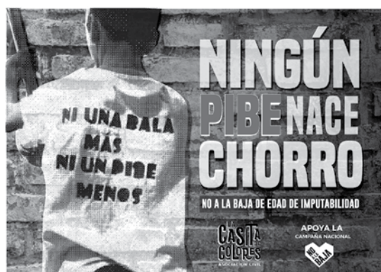
Figura 4 Sistema de afiches

Con respecto a la comunicación de uso interno, se trabajó en la realización de material didáctico pensado según la especificidad de cada taller, proporcionando una serie de cuadernillos a los que tenga acceso cada participante. En el caso del juego de recorrido Derechos Jugados [Figura 5] se ideó como una herramienta para el taller de juegos, con el que las psicopedagogas y las psicólogas que lo articulan, puedan abordar temáticas específicas con los niños y las niñas. De esta manera se estará incentivando la habilitación de la palabra, al generar espacios de debate colectivo en los que se pueden llegar a detectar las situaciones de vulneración por las que están atravesando.