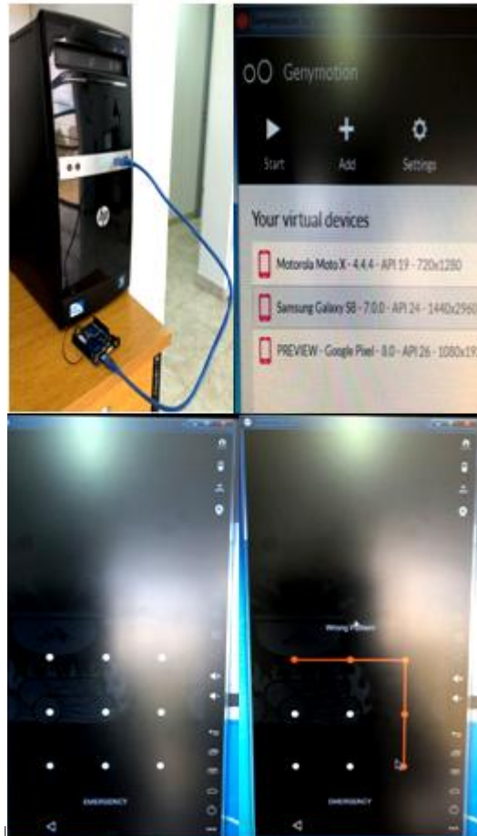
Figura 2. Pruebas de concepto sobre máquinas virtuales de dispositivos móviles Android

Samsung Galaxy S8 con sistema operativo Android 7) utilizando el software Genymotion 6 (cfr. Figura 2).