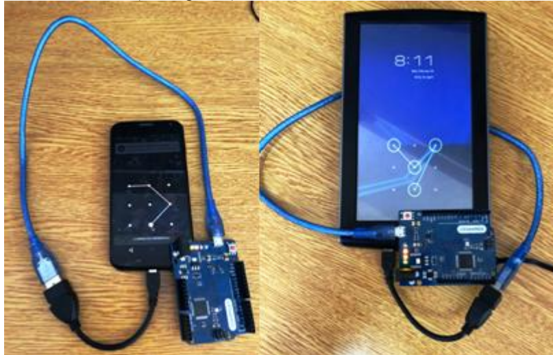
Figura 1. Pruebas de concepto sobre dispositivos móviles Android

Se desarrolló una solución de automatización denominada ALPFinder 4 , la que ha quedado disponible en GitHub para su descarga. Para la implementación de la herramienta de informática forense se utilizó el hardware Arduino 5 . Se optó por el modelo Arduino Leonardo ya que cuenta con una entrada USB integrada en la placa y ello facilita la interconexión con dispositivos móviles a través de un cable OTG. En el desarrollo del código se incorporó un método de ataque por diccionario considerando los resultados obtenidos en diferentes trabajos de investigación, los que han determinado los patrones de acceso más frecuentemente utilizados por los usuarios de dispositivos móviles y otros estudios sobre fortaleza de ALPs [Cha et al, 2017]. Asimismo, el software desarrollado realiza un ataque por fuerza bruta sobre el dispositivo móvil bloqueado por ALP, conectando patrones de cuatro a nueve puntos. Se efectuaron pruebas de concepto con diferentes dispositivos móviles obteniendo resultados satisfactorios (cfr. Figura 1).