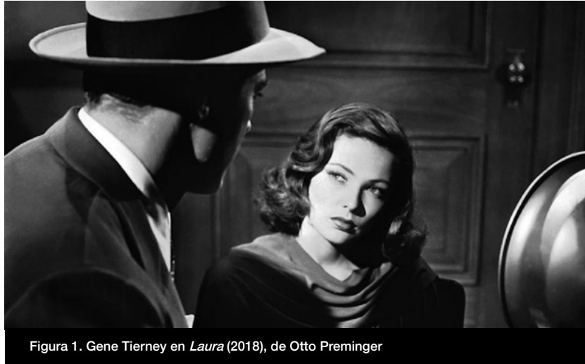
Figura 1. Gene Tierney en Laura (1944), de Otto Preminger

Un segundo capítulo («Historia de un movimiento artístico») presenta una minuciosa reconstrucción del contexto de producción en el que estos films surgieron: la posguerra norteamericana, un paisaje socioeconómico completamente reestructurado y con nuevas modalidades de producción y consumo de masas. Este apartado de Film Noir cuestiona aquella imagen extendida de Hollywood como un imperio capitalista homogéneo y, en cambio, lo analiza como una estructura social e industrial compleja, dotada de centros y de márgenes, de regímenes laborales, de burocracias, de experiencias de politización, de disputas de poder y de estrategias de resistencia. Esta revisión recupera: la importancia de las migraciones externas e internas; los procesos de organización sindical de sus trabajadores/as y la conformación de frentes populares de realizadores y de intelectuales para hacer frente a los mecanismos de explotación y de control; las disposiciones de la censura; el advenimiento de las listas negras y la consolidación de una derecha institucionalizada en Hollywood; las pujas con productores y con comités oficiales; las alianzas entre directores y guionistas, y la influyente complicidad que estos realizadores díscolos entablaron con escritores, como Vera Caspary, James Cain o Raymond Chandler.