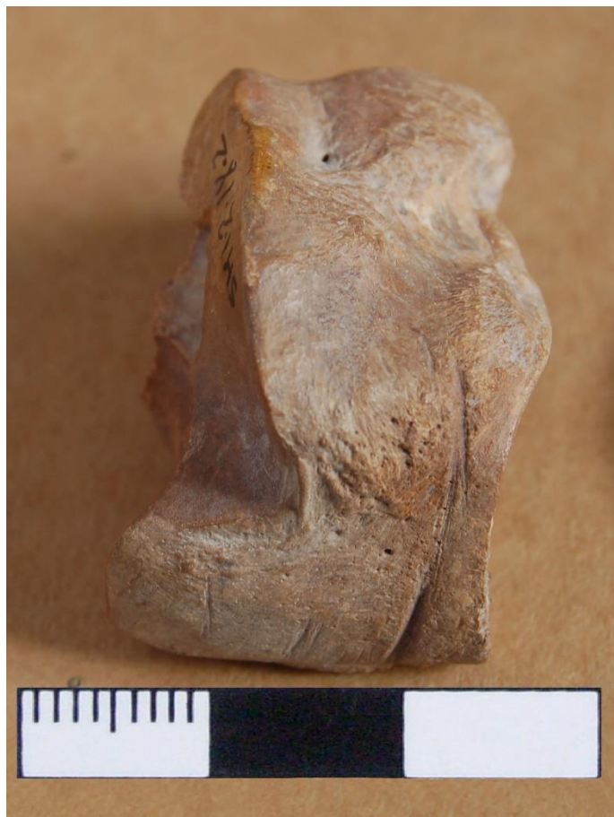
Figura 3. Marcas de cuereo y/o desarticulación realizadas sobre un cuboide de L. guanicoe .

Los estudios efectuados en este trabajo permiten profundizar la información sobre los procesos y agentes que intervinieron en la conformación del sitio San Martín 1, principalmente en relación con las actividades humanas involucradas en el procesamiento de las carcasas. En tal sentido es de destacar la presencia en el sitio de cuatro taxones que registran marcas antrópicas y que, por lo tanto, podemos asumir que fueron aprovechados por el hombre.