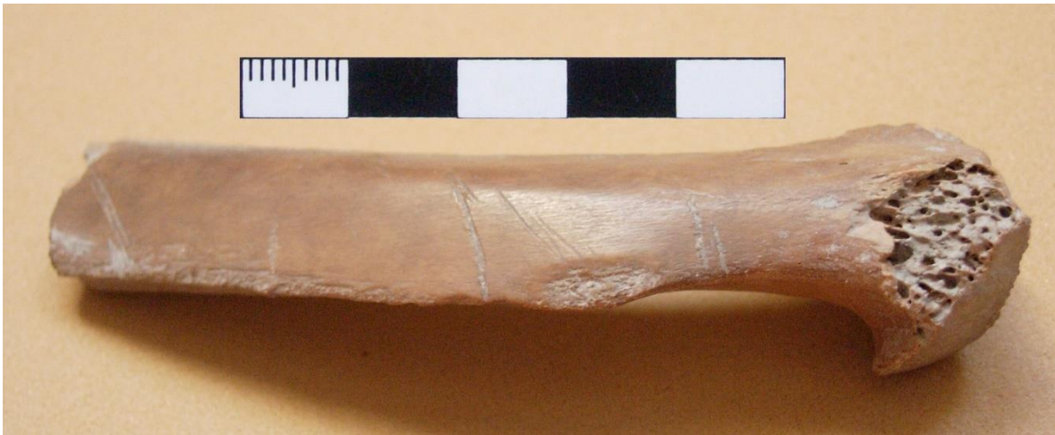
Figura 2. Marcas de descarte realizadas sobre una costilla de L. guanicoe .

Debido a que la distribución de los tejidos y sustancias del animal no se distribuyen homogéneamente en todo el esqueleto, generalmente se considera que los distintos elementos o áreas anatómicas no son procesados de la misma manera (Binford 1978). Es por ello que puede suceder que no todos los elementos óseos pasen por todas las etapas de procesamiento, o que incluso un mismo hueso presente marcas correspondientes a diferentes actividades. En el caso de R. americana se registró una sola marca en un fragmento de esternón, y considerando que es una zona del esqueleto que posee abundante grasa, se presume que la misma pudo ser producto de la actividad de descarte. En L. guanicoe y O. bezoarticus se registraron marcas que permitieron proponer que ambos taxones evidencian todas las etapas del procesamiento del animal (Figura 2). Sin embargo, en el caso de L. guanicoe la actividad que predomina es la del cuereo (Figura 3). Finalmente, se consideró que los restos de L. gymnocercus con marcas antrópicas son insuficientes para inferir las posibles actividades realizadas sobre este taxón, por lo que en la tabla 3 sólo se describen las características de las marcas.