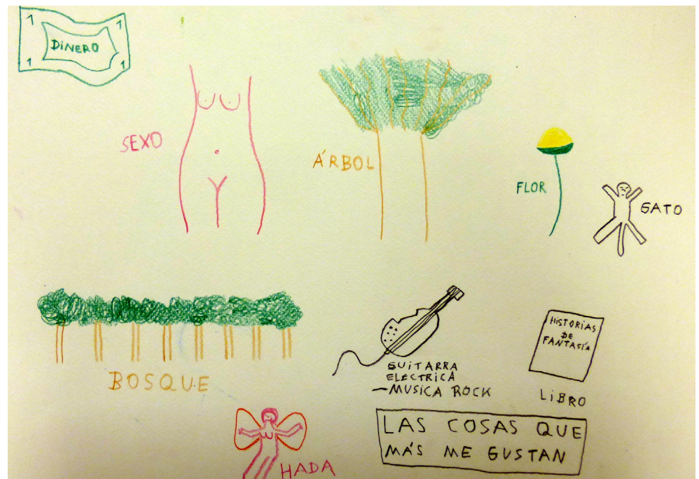
Figura 1. Obra “las cosas que me gustan” por DI. El participante muestra sus gustos y lo comparte con sus compañeros que aunque se conocen desde hace tiempo porque comparten diariamente los mismos espacios se muestran sorprendidos al descubrir cosas nuevas de él.