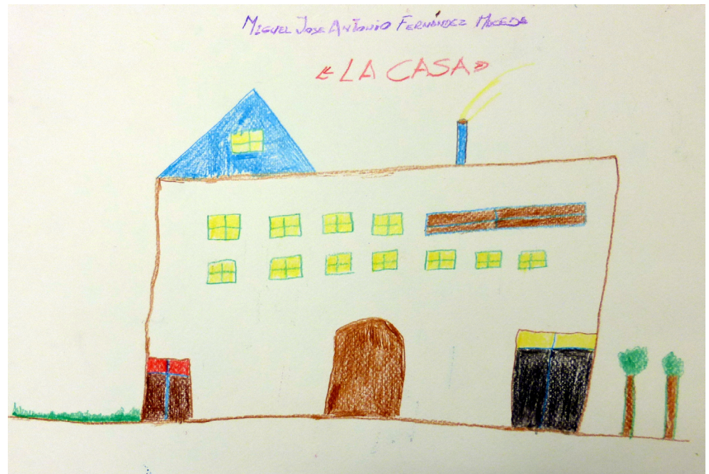
Figura 2. "La casa" por MI. MI realiza la casa en la que le gustaría vivir en un futuro, una casa grande en la que poder convivir felizmente con familia y amigos. MI expresa que este es un gran deseo que tiene desde hace años.