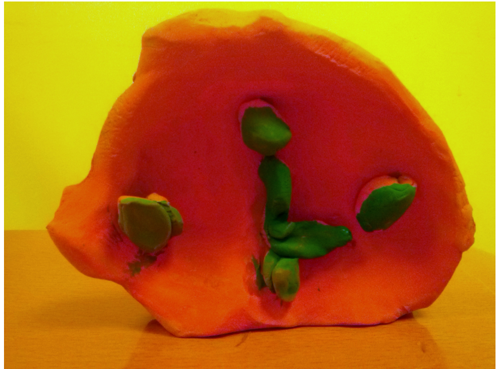
Figura 4. "En el reloj no avanzan las horas" por M.A.N. En la presentación de esta obra se hace alusión a que este reloj es como el reloj de la vida, donde no avanzan las horas.