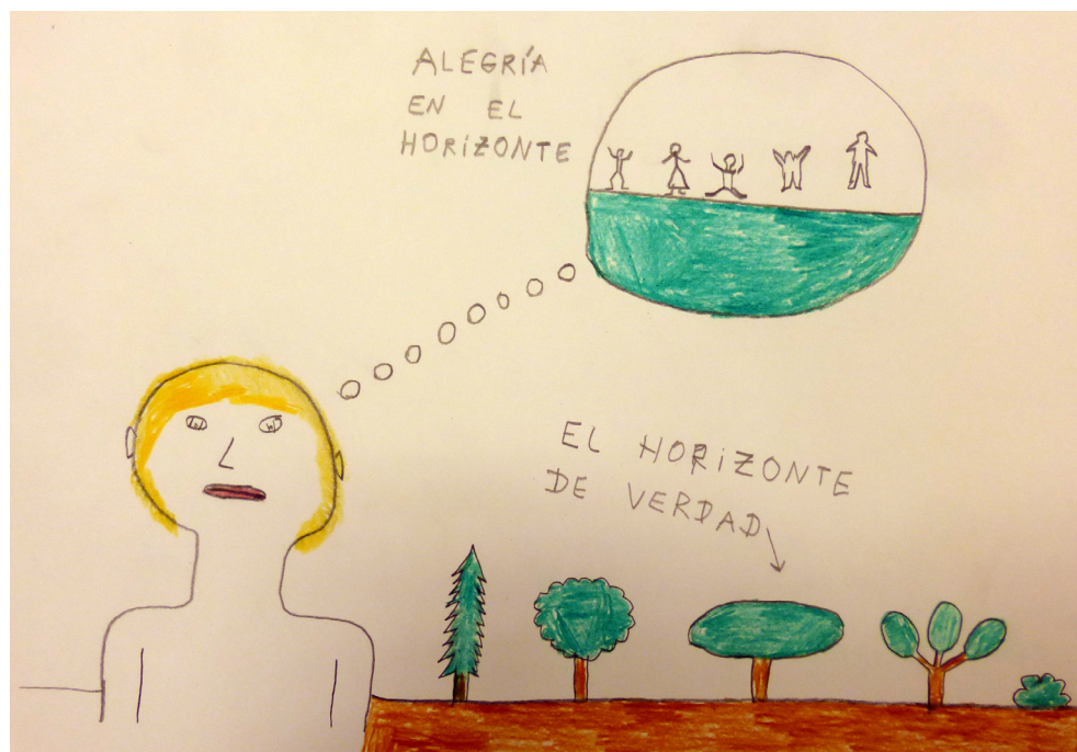
Figura 6. “Alegría en el horizonte”, obra realizada por DI. DI representa en su obra el horizonte de verdad y por otro lado el horizonte con el que sueña el ser humano.

Se responde por tanto al objetivo general de este trabajo así como los objetivos específicos. Las necesidades de cambio existen y se hacen reales cuando se da voz a las personas con enfermedad mental, cuando nadie habla a través de ellos, puede por tanto incluirse el Arteterapia entre uno de los recursos o herramientas que puede potenciar estas mejoras, en los que, los participantes, los profesionales de la salud e incluso la sociedad podamos crear entre todos, una realidad distinta.