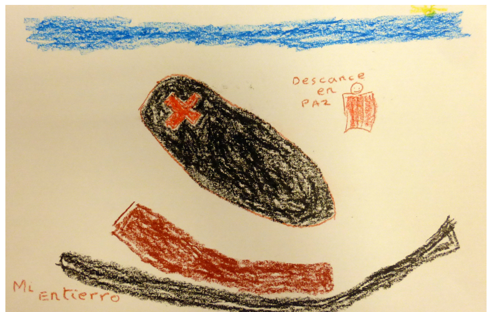
Figura 3. "Mi entierro" por RI. En esta obra RI, de 70 años de edad expresa su miedo a la muerte, muy presente en esos días para él a partir de la representación de su propio entierro.