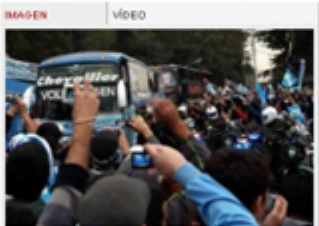
ADIOS. La Selección argentina de fútbol parte del ...

El plantel de la Selección despegó esta tarde hacia Sudáfrica para jugar el Mundial. El micro que trasladó a los jugadores desde Ezeiza tuvo una despedida emotiva de la gente.