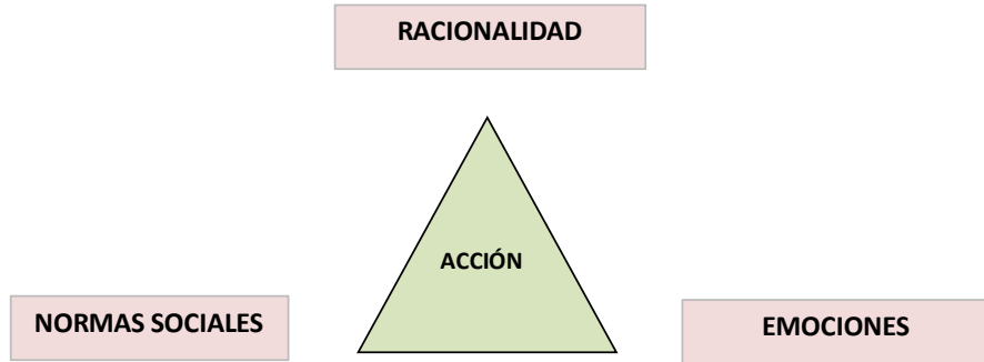
Figura Nro. 1: Teoría de la Acción

puede ser vista como normativa o prescriptiva. Como teoría normativa, nos indica cómo debemos proceder para alcanzar ciertas metas lo mejor posible, aún sin saber cuáles han de ser esas metas. Como teoría prescriptiva, nos brinda el soporte para predecir determinadas acciones.