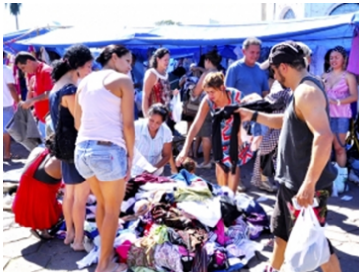
FIGURA 6 Comércio de roupas usadas nas feiras de Corumbá

gestão) são os feirantes – tanto brasileiros quanto bolivianos – que não são cadastrados junto à prefeitura, logo, não pagam tributos sobre a concessão e as vendas realizadas.