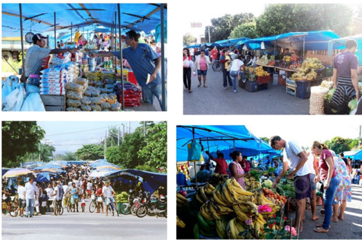
FIGURA 3 A feira livre de Corumbá

Nas feiras é vendida uma grande variedade de produtos. No levantamento realizado por Pinto et al. (2013) constatou-se que a maioria dos produtos vendidos eram frutas, verduras e legumes (33,5 %), seguidos de roupas e utensílios domésticos (32,8 %) e outros (brinquedos, CDs e DVDs, bijuterias, perfumaria, ferragens, aviamentos, artesanatos, acessórios para celular, eletrônicos, ervas medicinais, comidas, leite e derivados, entre outros), correspondentes a 33,7 % dos produtos oferecidos