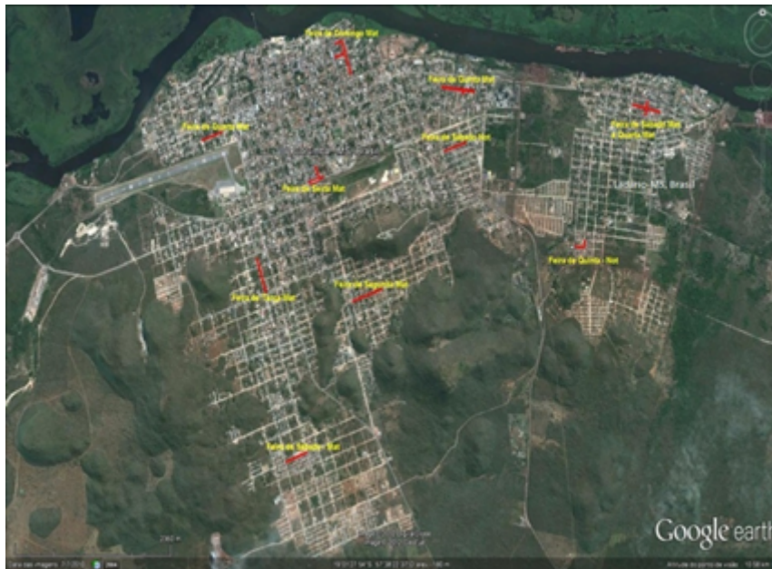
FIGURA 2 Localização das feiras livres nas cidades de Corumbá e Ladário