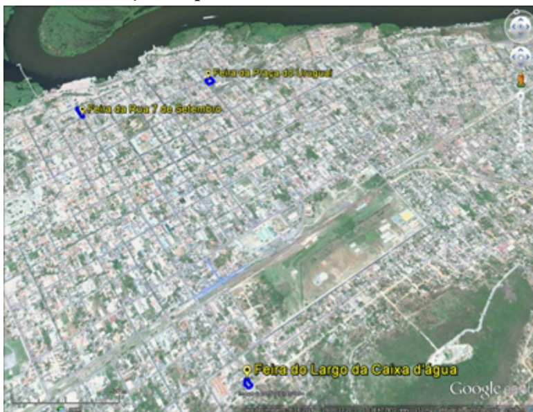
FIGURA 1 Localização das primeiras feiras livres de Corumbá

Fonte: Jornal A Tribuna (Edição nº17.731 de 3/5/1960). Org. Espírito Santo, A. L. Google Earth. Image © 2016 DigitalGlobe.