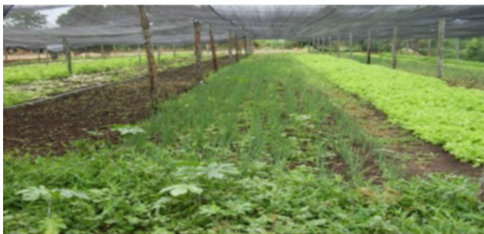
FIGURA 5 Horta em Puerto Suárez, Bolívia

Ainda com relação aos produtos, os dados apresentados por Pinto et al. (2013), podem ser cruzados com a visita nas feiras (trabalho de campo) e com a pesquisa de Souza (2010), que realizou um estudo sobre as hortaliças de origem boliviana ofertadas nas feiras livres de Corumbá. Segundo a autora, tanto em Puerto Quijarro como Puerto Suárez destacam-se o cultivo do milho, do feijão e da mandioca. Esses cultivos são para a própria subsistência da família e o excedente é comercializado junto com as frutas, verduras e legumes nas feiras livres de Corumbá. Contudo, vale ressaltar que durante a execução dessa pesquisa, ao serem questionados sobre a origem dos produtos comercializados na feira (principalmente frutas, verduras e legumes), os feirantes bolivianos não souberam dizer se existe presença de agrotóxicos. Os feirantes informam que de Puerto Suárez e Puerto Quijarro vêm às hortaliças e as ervas medicinais vendidas na feira (Figura 5).