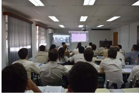
Fig.1- Los alumnos en la C.N. Atucha