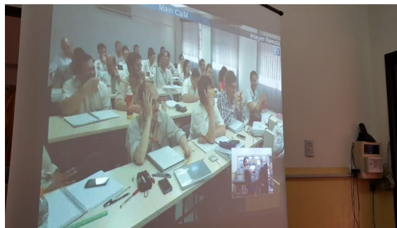
Fig4 - Vista desde la Consola de Operación del RA-0