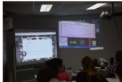
Fig. 4. Visión de otros