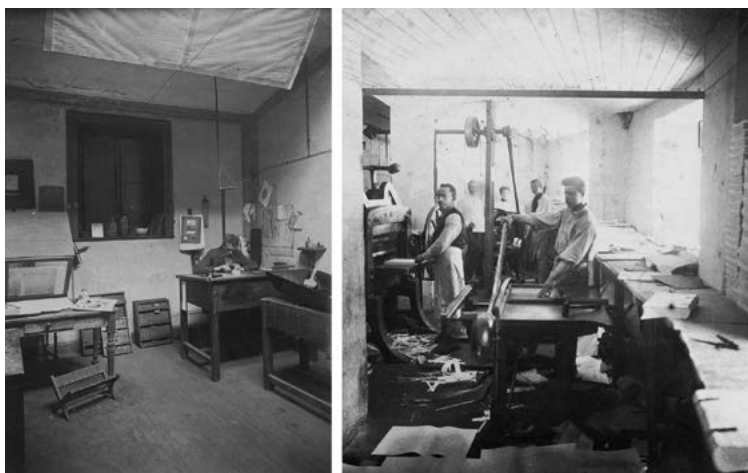
Figura 3. Secciones de Grabado y Encuadernación (c. 1900).

exclusiva de esa firma. Mientras que las de marca Krause y Ausberg fueron adquiridas a la importadora Curt Berger, pero recién a partir de 1894, año de su apertura [Figura 3].