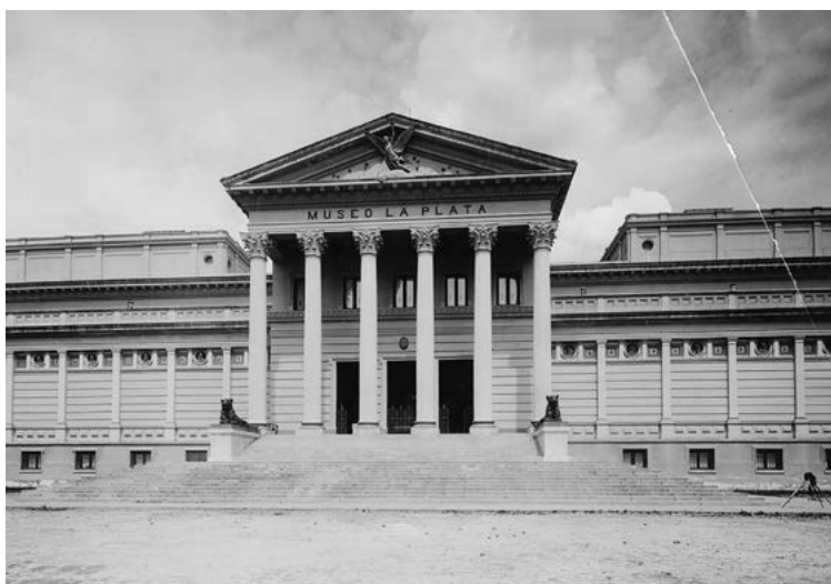
Figura 1. Museo de La Plata (1988).

los de herrería y carpintería, que fueron la base para la preparación y la restauración de las colecciones y la concreción del ansiado proyecto. Hacia 1890 se comenzó a formar un grupo integrado por expertos, fundamentalmente de origen extranjero, que iban a estar a cargo de las diferentes secciones que se creaban con la idea de formar un centro de investigaciones, un verdadero «Oxford» o «Cambridge Sudamericano» (Museo de La Plata, 1896). De esta manera, se acercaron investigadores, como Carlos Spegazzini (Botánica), Santiago Roth (Paleontología), Rodolfo Hauthal (Mineralogía y Geología), Fernando Lahille (Zoología), Herman Ten Kate y Rodolfo Lehmann-Nitsche (Antropología). Según la idea original, los aportes de este plantel de especialistas alimentarían la producción de una imprenta propia capaz de producir obras de elevada calidad gráfica y las publicaciones que allí verían la luz servirían para ser canjeadas por otras similares editadas en el extranjero, lo que contribuiría, a su vez, al crecimiento de la Biblioteca con información científica actualizada [Figura 1].