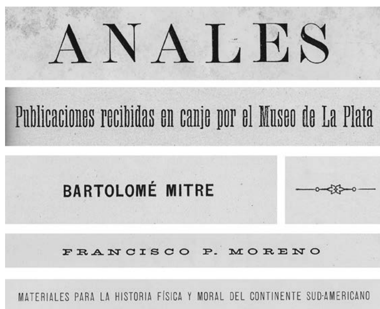
Figura 4. Algunas de las tipografías utilizadas por el taller. Composición realizada por el autor

Estas denominaciones, que por lo general eran determinadas por las importadoras, no fueron respetadas en el inventario practicado por Wilcke, quien las individualizó aplicando criterios de uso (por la obra que se realizaba con esa letra, como el Boletín Judicial y el Censo , que dieron nombre a Boletín y Censo ), de estilo (medieval), variables (bastardilla, negrita, versalita) y de cobertura idiomática (griego, alemán, inglés, francés). De esa manera, aparecen letras identificadas como «1 caja doble negrita cuerpo 8 Boletín», «4 K. números, cuerpo 9 medieval» o «1 caja versalitas cuerpo 12 francés». Los tipos se ubicaron en veintiún chivales , dos estantes para cajas y un estante para cajas de números. En la sección de encuadernación también hubo letra. En el inventario se contaron veinticuatro «alfabetos de bronce para dorar a máquina» de alturas que iban entre los 3 y 25 mm, adornos para uno y dos colores, bigotes, rayas, filetes, florones y un escudo de la provincia de Buenos Aires. Además, se mencionaban formas e imposiciones para diferentes publicaciones, como los Anales y la Revista del Museo , y un centenar de galvanos con escudos argentinos, logotipos y rótulos como los del Registro Civil y el Museo La Plata, 28 galvanos en madera y 2030 clisés para diferentes obras [Figura 4].